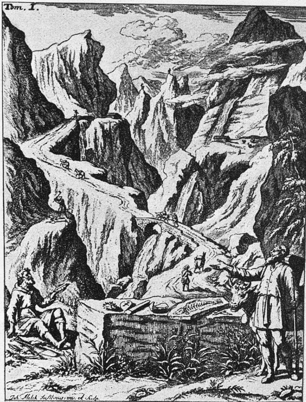
Die Schöllenen Schlucht.