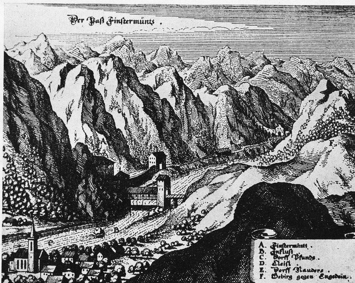
Der Paß Finstermünz. Aus Merians „Topographia“ 1677.

Aber auch im Mittelalter verlor das Hochgebirge nichts von seinem Schrecken; im Gegenteil: Drachen, Geister und Riesen bevölkerten seine Täler, und wer es nicht mußte, der betrat die Berge nicht. Aber viele mußten! Der Handel