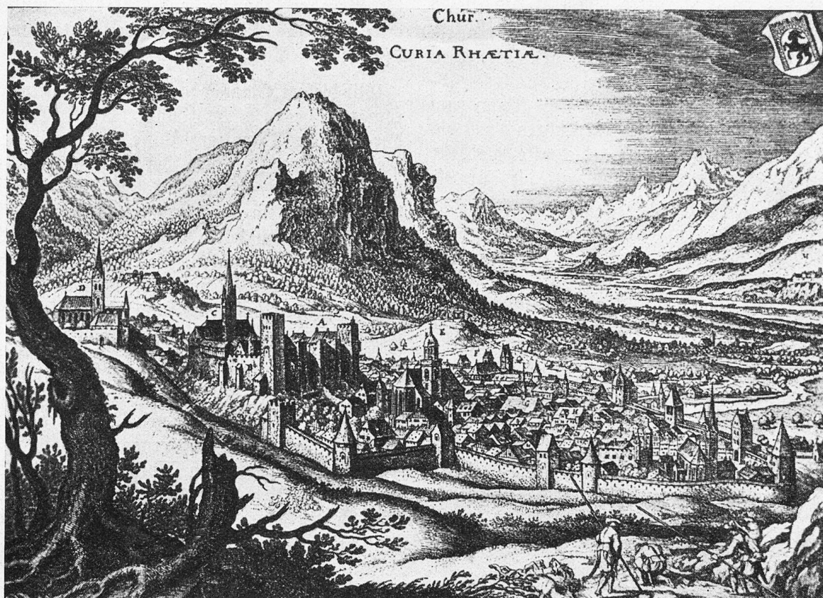
Chur. Aus Merians „Topographia Helvetiae“. 1644.

bus commentarius“ (1574), das eine für damalige Verhältnisse überraschend gründliche Kenntnis der Bergwelt beweist. Simler widmet seine Aufmerksamkeit vor allem den Pässen, die sich „durch die hohe Mauer der Alpen bohren“. Das interessanteste Kapitel ist wohl das, das sich mit den „Schwierigkeiten und Gefahren der Reisewege in den Alpen und wie man sie bewältigt“ befaßt. Hier entdeckt man neben manchen merkwürdigen Dingen viele auch heute noch gültige Feststellungen. Die Bestätigung, daß die Pässe auch damals nur Saumpfade, nicht aber Fahrwege waren, wird bei einer Lektüre leicht erbracht. „Auch flößt der Tiefblick in die Täler dem Wanderer solch einen Schreck ein, daß er sich aus Furcht, von Schwindel ergriffen zu werden, von Einheimischen, die an diese Wege gewöhnt sind, an der Hand führen läßt“. Vor allem, was ein Bergwanderer wissen muß, ist in dieser Anleitung die Rede, von Lawinen, von Kälte, von Sturm und von der Ausrüstung.