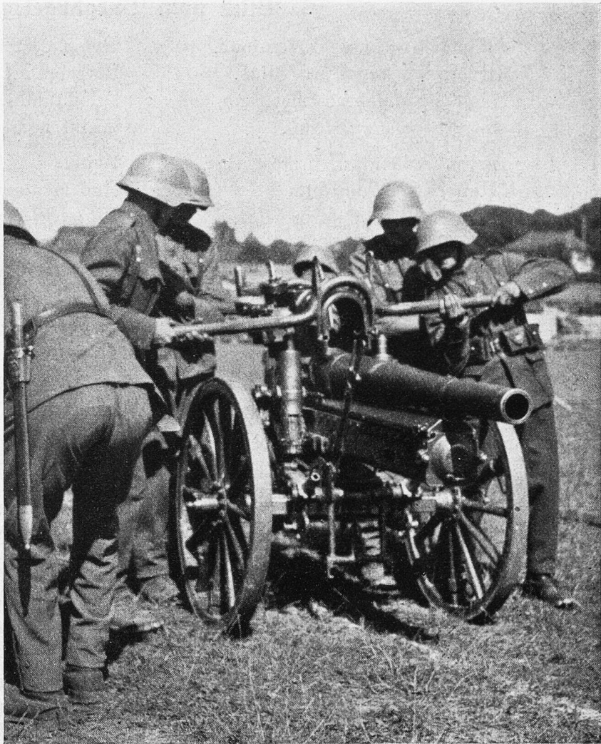
Das neue 7,5-cm-Gebirgsgeschütz.

Die Frauen treten in die Lücke. Sie fangen an, Männerarbeit zu verrichten. Sie stehen im Stall und sitzen am Steuer des Lastwagens.