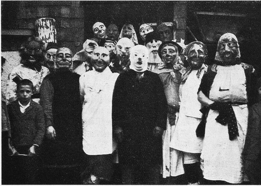
Eine drollige Gesellschaft von Flumser Buzi.