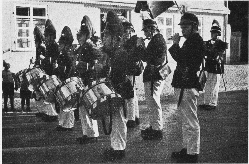
Aschermittwoch in Elgg. Junge Elgger Tambouren und Pfeifer.

Verbrennen der heidnischen Böögg nicht mehr und begnügt sich mit Fastnachtstfeuern, Funken, wie man sie in der Ostschweiz nennt. Mit dem Funken-sonntag zusammen geht das auf einen heidnischen Sonnenkult hindeutende Scheibenschlagen und Fackelschwingen an Fastnacht. Beim Scheibenschlagen werden runde oder viereckige Hartholz-scheiben in einem kleineren Feuer glühend gemacht, an lange Haselruten aufgespießt und von flachen Böcken ins Tal hinuntergeschlagen. Das Scheibenschlagen war früher sehr verbreitet, findet sich aber jetzt nur noch in der Gemeinde Wartau im Rheintal, in Untervaz, Danis und Tavanasa, im Unterbaselbiet, sowie am Sonn-