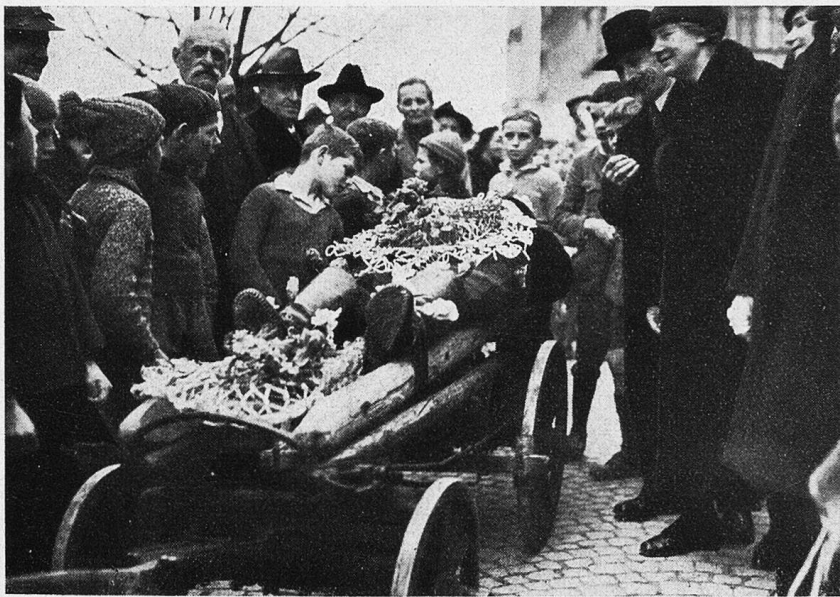
Die Verbrennung des „Gideo Hofenstoß“ in Herisau. Gideo Hofenstoß auf dem Totenwagen.

Einige Einzelbräuche, die im Mittelalter, zum Beispiel in kirchlichen Bräuchen, wurzeln, mögen auch erwähnt sein. Da gibt es einmal eine Weggen-spende an die Kinder an der alten Fastnacht in Oberstammheim, die aus einer alten Zehnten-spende des Klosters St. Gallen hervorgegangen ist. Rapperstwil hat eine ähnliche Kinderbescherung, das „Eis, zwei Geißbeißer“ am Fastnacht-Dienstag. Da werden von den Kindern Gaben am Rathaus ge-angelt, oder man wirft sie ihnen auch hinab. Der Ursprung dieses Brauches ist etwas unklar.