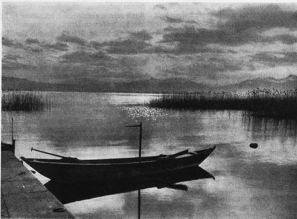
Morgenstimmung am Zürichsee.

Dann folgten Tage, die wärmer waren. Unversehens begann es zu schneien. Ein saches Schäumlein wurde auf die blanke Decke des Sees gelegt. Das Schäumlein wurde zu einem soliden Gewebe, bald war das dichte Linnen fertig, und jetzt hatte der See noch einmal ein neues Aussehen bekommen. Jetzt war er ganz gestorben. Er war verstummt und schien nie mehr erwachen zu wollen. Bald kamen die Ameisen wieder. Zuerst tasteten sie mehr, als daß sie frisch-fröhlich ihres Weges zogen, und als die ersten den Bann ge-