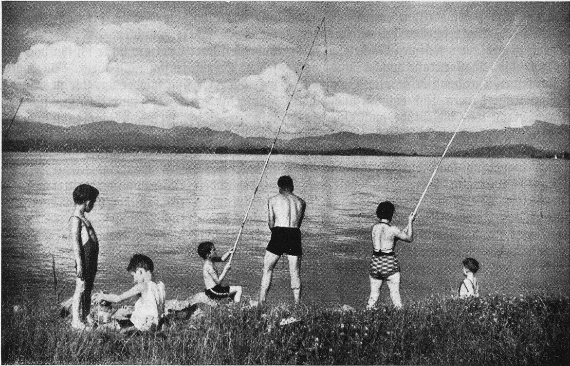
Sonntagsfischer am Zürichsee. Blick nach der Insel Ufenau.