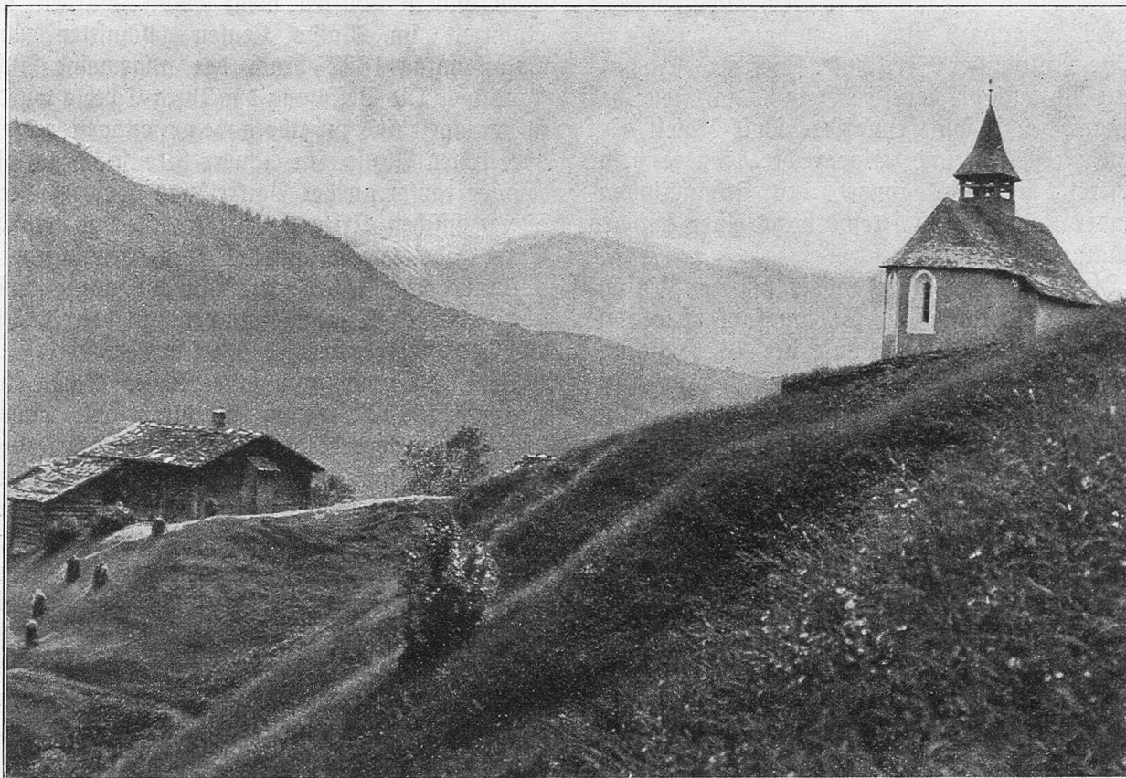
Kirchlein Schuders ob Schiers (Prätigau).