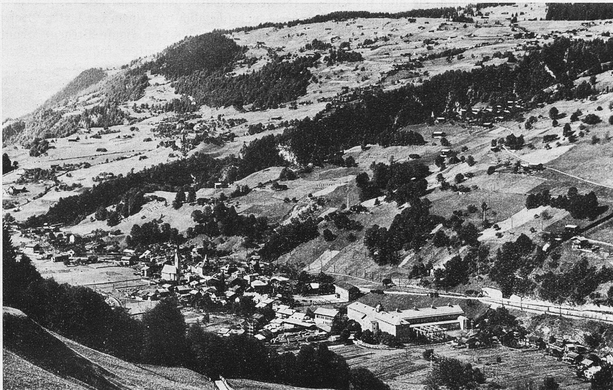
Rüblis, Luzein, Delfs und Panh.

Dörfern Buchen und Lunden auf der rechten Talseite.