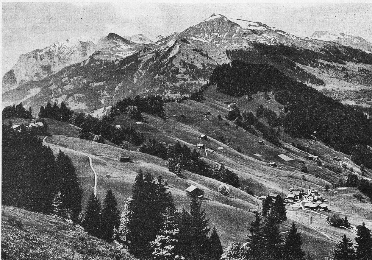
Valzeina mit Falknis und Vilan.

So schön und wohnlich sich das Prätigau mit seinen hübschen Dörfern jetzt präsentiert, früher muß es hier unwirtlich, urwaldgemäß ausgesehen haben. Es ist daher nicht verwunderlich, daß weder in prähistorischer noch in römischer Zeit nennenswerte Siedelungen bestanden haben. Der