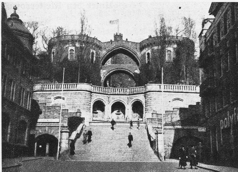
Hälsingborg, Terrassenaufgang zum Kärnan.

Wer nach Arild kommt, unterläßt es natürlich nicht, einen der Gipfel des Kullerrückens zu besteigen. Er geht am Strand mit seinen ausgespannten Fischernezen vorbei durch hochstämmi-