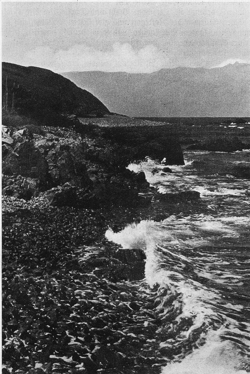
Strand bei Arild mit Kullaberg.

Und zu gelegener Zeit kommt man ans Meer selbst. Man sieht Hälssingborg, terrassenförmig abfallend zum Öresund, dessen Wasser die schmale Enge zwischen Hälssingborg und Helsingör, der Stadt Hamlets, bildet. Über die trennenden fünf Kilometer hinüber sieht man die grün patinierten Dächer und Türme der dänischen Hafenstadt leuchten. Schön ist es, an Hälssingborgs Wellenbrecher zu stehen, die Möven zu beobachten, die in Scharen den Hafen umkreisen, die Fähre zu sehen, die den Verkehr zwischen Schweden und Dänemark vermittelt, während große und kleine Schiffe nord- und südwärts ziehen. Die Meeresfläche schimmert je nach Jahreszeit und Wetter in den Schattierungen von blau, grün und grau. Große Verladeanlagen, Krane und Magazine lassen die Bedeutung Hälssingborgs als Seehandelsplatz erkennen. Südlich von dieser Stadt an der Küste liegen Landskrona und Malmö, die drittgrößte Stadt Schwedens, nördlich hat der schöne Sandstrand eine Reihe von Badeorten geschaffen. Eines dieser Stütchen erinnert man sich besonders gern, weil es durch seine Lage am Fuße des Kullaberget, durch ausneh-