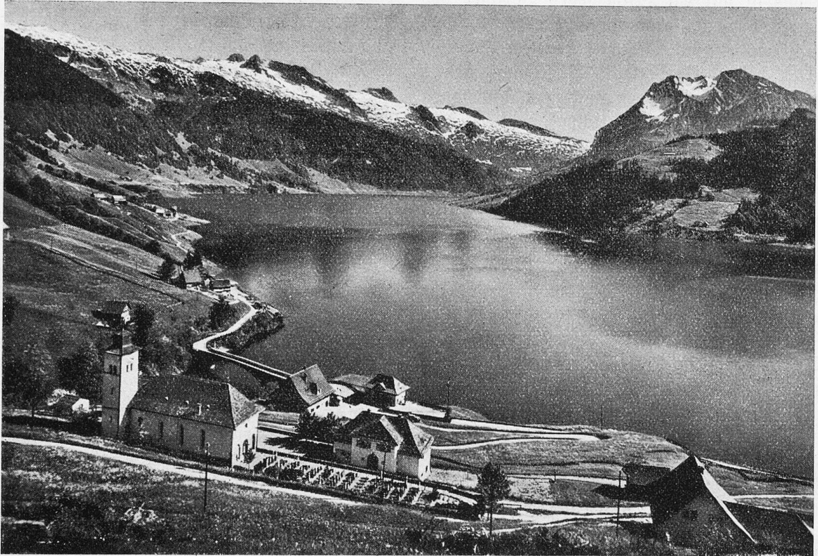
Innertal am Wäggitalsee.

Wie weit ist überhaupt der Kreis gezogen?