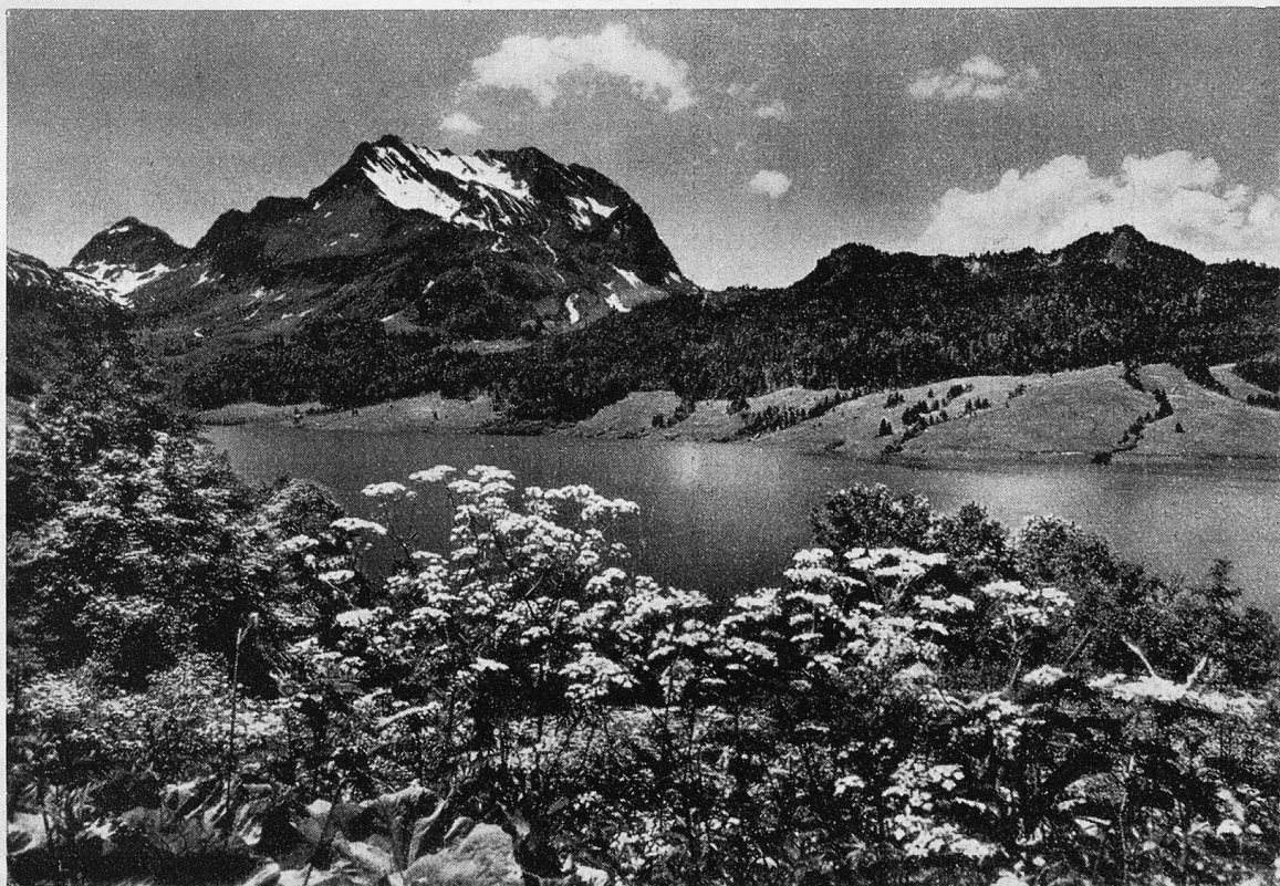
Frühling am Wäggitalsee.

Wie stark wirken solche Worte, in der Umgebung genossen, in die sie gehören!