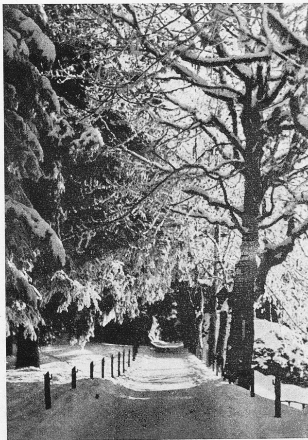
Weg nach dem Käuzeli

Da wird der Rigi zum treuen Helfer eines jeden, und jeden läßt er selig werden nach seiner Art und wie es ihm gefällt. Der eine schnallt sich