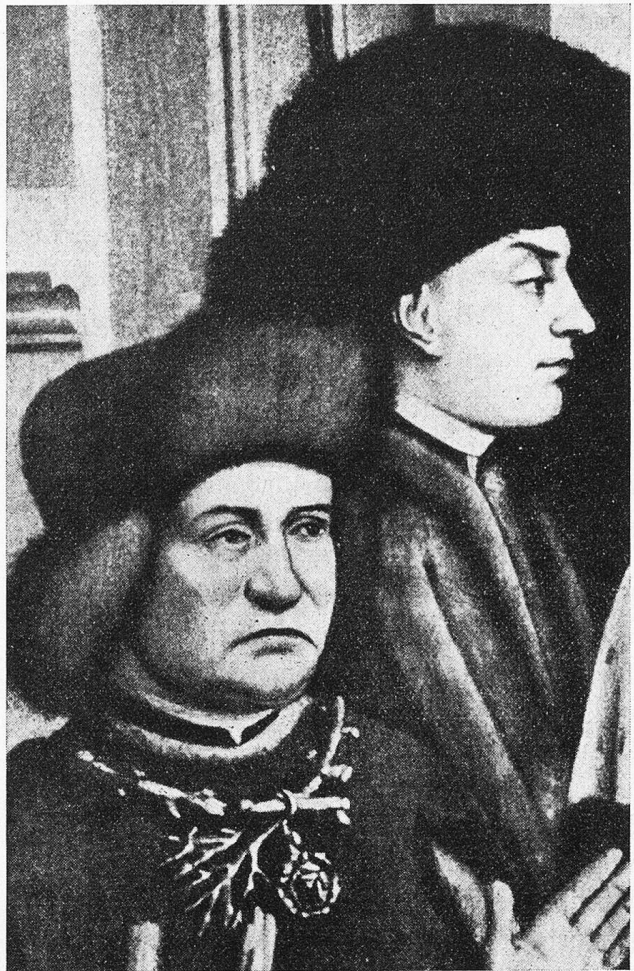
Zum Artikel „Der Genter Altar“:

Als der Wachtmeister die Tür gehörig verschlossen und verriegelt hatte, richteten wir unsere Aufmerksamkeit auf den Höhenzeiger und auf den Indikator der Steigerungsgeschwindigkeit. Wir hatten vorher alle Füllfedern wegzulegen; denn sie pflegen im luftverdünnten Raum ihren Saft, mit dem sie allzuoft geizen, freiwillig von sich zu geben. Der Arzt kontrollierte das Telefon und die Signale, bevor er die Luftpumpe in Tätigkeit setzte. Der Höhenzeiger klimmt rasch die ersten hundert Meter empor, die Steigungsgeschwindigkeit ist beträchtlich. Bis auf tausend, ja bis auf zweitausend Meter ist wenig zu spüren. Nur ein Klemmen in den Ohren, wie man es in der Eisenbahn beim Einfahren in einen Tunnel bemerkt, ist vorhanden, außerdem werden uns die Gürtel zu eng. Auf 4000 Meter angelangt, verlangsamt der Arzt die Steigung, damit man sich der Höhe etwas anpassen kann. Wir versuchen es mit der Sauerstoffmaske, deren labender Inhalt den ganzen Menschen aufleben läßt. Dann geht die Reise ohne Sauerstoff weiter. Wir steigen auf 5000, 6000, 7000. Jeder von uns Versuchskaninchen hat einen Bogen Papier vor sich mit dem Auftrag, die Zahlenreihe von 1000 rückwärts aufzuschreiben. Also schreiben wir: 999, 998, 997 usw. und bemerken dabei kaum, wie unsere Schrift sich verändert; ab und zu passiert uns ein Fehler, wir verbessern ihn so gut es geht. Doch werden die Aufzeich-