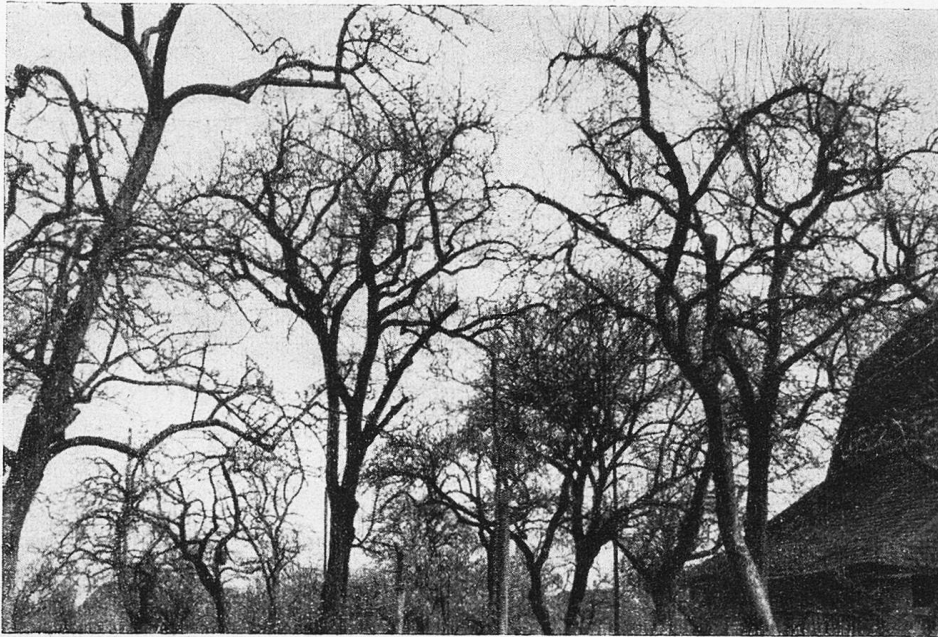
Folgen der Vernachlässigung

spritzt wurde. Von maßgebender Seite wird auch erklärt, daß wir ohne die seit Jahren rationell gepflegten Baumbestände mit einer um die Hälfte geringern Ernte 1942 hätten vorliebnehmen müssen. Dazu ein Beispiel: Von 31 behandelten Boskop-Bäumen lieferte im letzten Herbst jeder durchschnittlich 236 Kilo Apfel, während zwei unbehandelte Bäume in der nämlichen Anlage je nur 7 Kilo Apfel brachten.