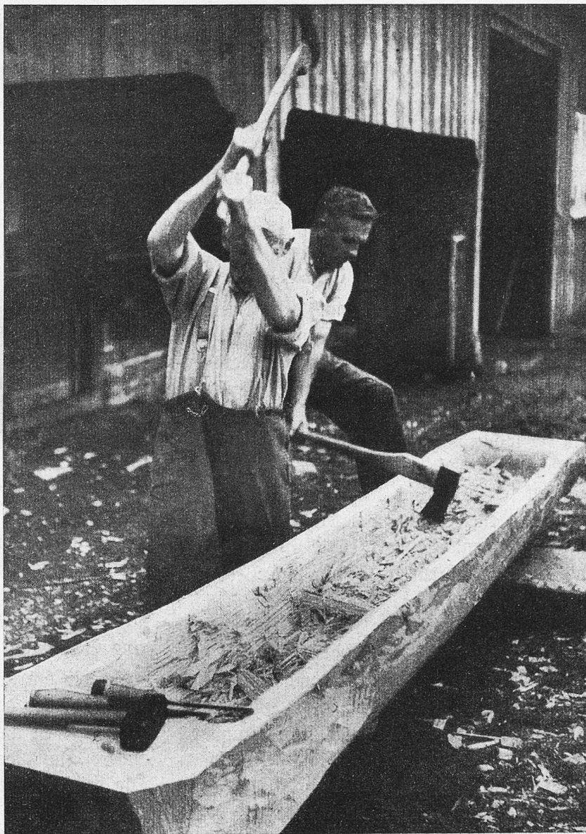
Ein neuer Alpbrunnen wird zugerichtet

Dann aber geht's in die Tiefe, zuerst in rauhem Weg über eine steile Halde, im Zickzack, noch lange mit Sicht des Kulmes. Dann tauchen sie mählich unter, die Großen; dafür kommen die vordern Höhenzüge kräftiger zur Geltung, die