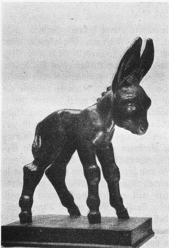
Eselein von Tivoli

Er hat mir eine Anekdote erzählt. „Wissen Sie“, sagte er, „einst mußte ich in Paris in meinem Atelier das Kamin rußen. Wir Künstler haben damals alles selber gemacht. Aber ich war