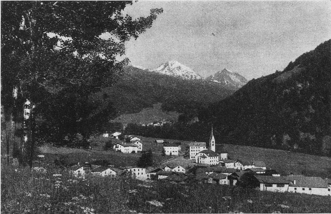
Sa. Maria im Münstertal

Fuldera, die auf einer grünen Wiese, rings vom Wald umsäumt, still und friedlich eingebettet da liegt. Die hübsch renovierte Kirche stammt aus dem Jahre 1708. Durch Wälder und Wiesen pilgerten wir weiter abwärts und erblickten plötzlich nach dem Waldesaustritt die untern Ortschaften Balcava, Santa Maria und Münster.