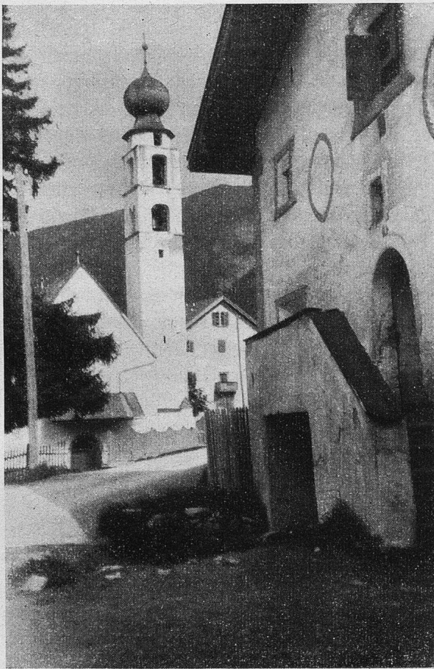
Evangelische Kirche in Valcava, Münstertal

Noch heute erinnere ich mich des milden Sommerabends vor unserm alten Gasthause, wo von den nahen und weiten Kirchtürmen des Tales die Abendglocken läuteten und ernst und feierlich die Felsgipfel der nahen Berge in die Landschaft hineinragten. Wir genossen die wunder-same Stille und die herbe frische Bergluft. Wahrlich, Santa Maria eignet sich in jeder Beziehung zu einem Ferienurlaub! Jeder Berg- und Kunstfreund sollte einmal einige unbeschwerte Tage im schönen Bündnerdorfe, weitabgelegen vom Alltagslärm, verbringen! Ein kleiner Ab-