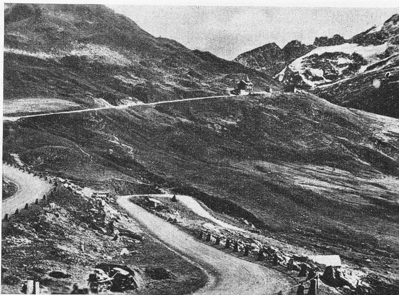
Eine der letzten Kehren, die zur Paßhöhe auf der Urnerseite führt

Ist so etwas überhaupt noch modern, kann man sich fragen, wo doch mit der Freigabe des Benzins der Autoverkehr bei fanatischer Begeisterung dermaßen eingesezt hat, daß sonntags das ganze, liebe Schweizerland über alle fahrbaren Pässe und in alle Winkel abgerast wird? Doch selbst der Autoverkehr scheint mir heute nicht mehr das Modernste zu sein, nachdem die Entfernung von Land zu Land, von Kontinent zu Kontinent verkürzt und die Welt scheinbar für die Menschen kleiner geworden ist. — Und trotz alledem der Klausenpaß einmal zu Fuß mit bedächtigen Schritt wie in der guten alten Zeit, dies dürfte für jeden, dem das Herz am rechten Ort schlägt, eine recht vergnügliche Wanderung bedeuten, wo er seine patriotischen Knabenträume wieder aufleben lassen könnte. — Dieser Schweizeralpenpaß bietet eigene und schönste Naturwunder. Aus Gründen der Hebung wirtschaftlicher und militärischer Kraft wurde die Klausenstraße über den 1952 m hohen Paß um die Jahrhundertwende erbaut zur Verbindung der Zentral- mit der Ostschweiz. Es gibt in den gesamten Alpen keine zweite Bergstraße, die auf verhältnismäßig kurzer Entfernung von bloß 25 Kilometern Tiefstal mit Tiefstal verbindet und zugleich in die Region der Gletscherwelt hinaufdringt. Von Altdorf aus, wo auf dem Hauptplatz vor dem Turm das Tellendenkmal steht,