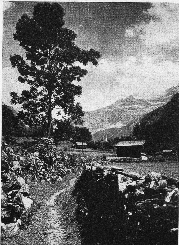
Am Wege nach im Unterschächen

Schon ist Urigen erreicht. Auf einem eigent-lichen Plateau stehend, genießt der Beschauer hier einen selten schönen Rundblick zum Brunnit-tal hinüber und zu den schartigen Wänden der großen Windgälle hinauf. Ein kleiner Fußweg führt von hier zur nahegelegenen Alpenkapelle von Getschweiler, die in ihrem Altargemälde ein kostbares Kleinod bietet, eine Pietà, die einst ein Urner Condottiere durch einen berühm-ten Maler aus der Bologneserschule, genannt Fiamingo, malen ließ und der Kapelle stiftete. So zog auch die Kunst in diese Höhen der Na-turschönheit. Und wem Lust ankommt, sich an den Pforten des kleinen Kirchleins auszuruhen, um dabei die Geschichte des Suworowschen Al-penüberganges zu studieren, der nehme den nö-tigen Lesestoff und die Karte mit. Von Spirin-gen aus mußte das Russenheer, vom Gotthard kommend, schon übel mitgenommen, wieder an-steigen zum 2076 m hohen Kinzigkulum und auf Schlitten und Schleifen die Kanonen mitschlep-pen, zum Übergang ins Muottatal, neuen Kämpfen und neuen Pässen zu, weil kein Durch-