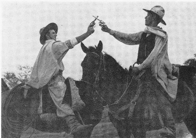
Gauchos bei der Begrüssung

Die Weihnachtseinkäufe sind erledigt, und ich möchte nun Sie, verehrte Leser, einladen, mit mir die Stadt zu verlassen und mich draußen in meinem Hause zu besuchen. Dazu müssen wir den Omnibus nehmen. Auf der Bank neben uns sitzen ein kleiner Junge und ein Mädchen. Sie machen, obwohl der Omnibus ganz tüchtig schaukelt, ihre schriftlichen Rechenaufgaben. Der Junge trägt eine katzenfarbene Uniform mit langen Hosen, Koppel und Schirmmütze, das Mädchen einen kurzen blauen Rock und weiße Bluse.