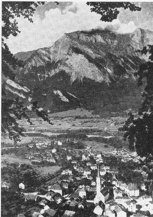
Ragaz mit Falknis

Das Ragazer Land ist ein gesegnetes Land, schon von alters her. Die Römer streiften hier vorbei, an der Porta romana. Das war ja der