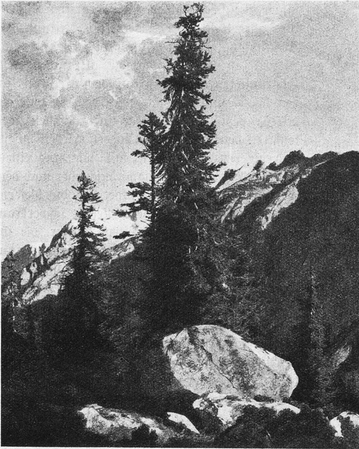
Alexander Calame: Tannen an der Handegg.

Die Ausstellung, die seit dem 17. August das Kunstmuseum Winterthur veranstaltet, ist ein Ereignis im schweizerischen Kunstleben und verdient die Beachtung weitester Kreise. Die Einladung zum Besuch der seltenen Schau ist auf guten Boden gefallen. Reges Leben herrscht in den Sälen, und auswärtigen Gästen wird es in verdankenswerter Weise ermöglicht, an Dienstagen und Donnerstagen auch nach Feierabend einen Gang zu machen durch die Ausstellung. Ein schöner, reich illustrierter Katalog dient als Führer und gibt knappe Aufschlüsse über die Maler, die mit ausgewählten Werken vertreten sind.