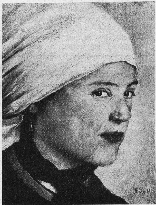
Wilhelm Leibl: Mädchen mit weissem Kopftuch.

Unsere großen Maler aus der Mitte des letzten Jahrhunderts haben fürs Herz gemalt. Sie schilderten ihre Träume und führten in Wälder und Städtchen, wo einem wohl ist, wo Käuze wohnen und ein Wanderer sich ins Grüne gelegt hat, um von hoher Warte ins Tal zu schauen, über Höfe und Hügel und nach fernen Horizonten. Wie könnte man zum Beispiel vorübergehen an Hans Thomas Lannusbild, ohne ihm ein Weilchen glücklicher Betrachtung zu widmen. Eichendorffsche Naturfreude liegt in ihm, Entrücktheit in eine schöne Landschaft, über die sich ein blauer Himmel spannt, und