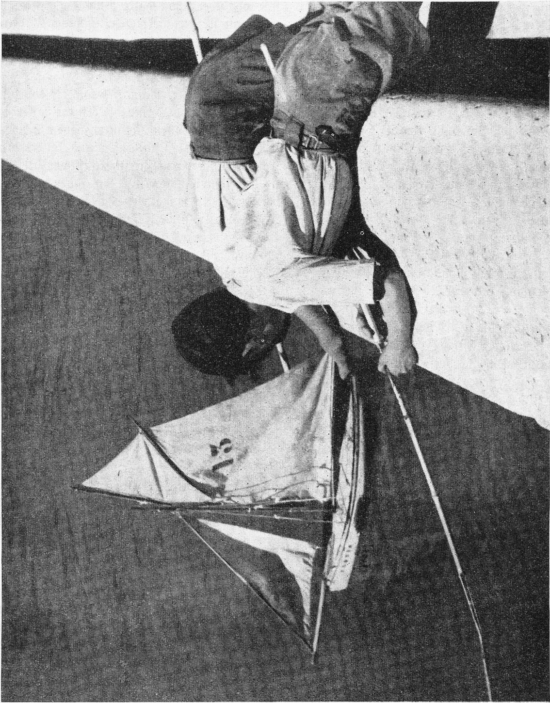
GLÜCKLICHE JUGEND . . .