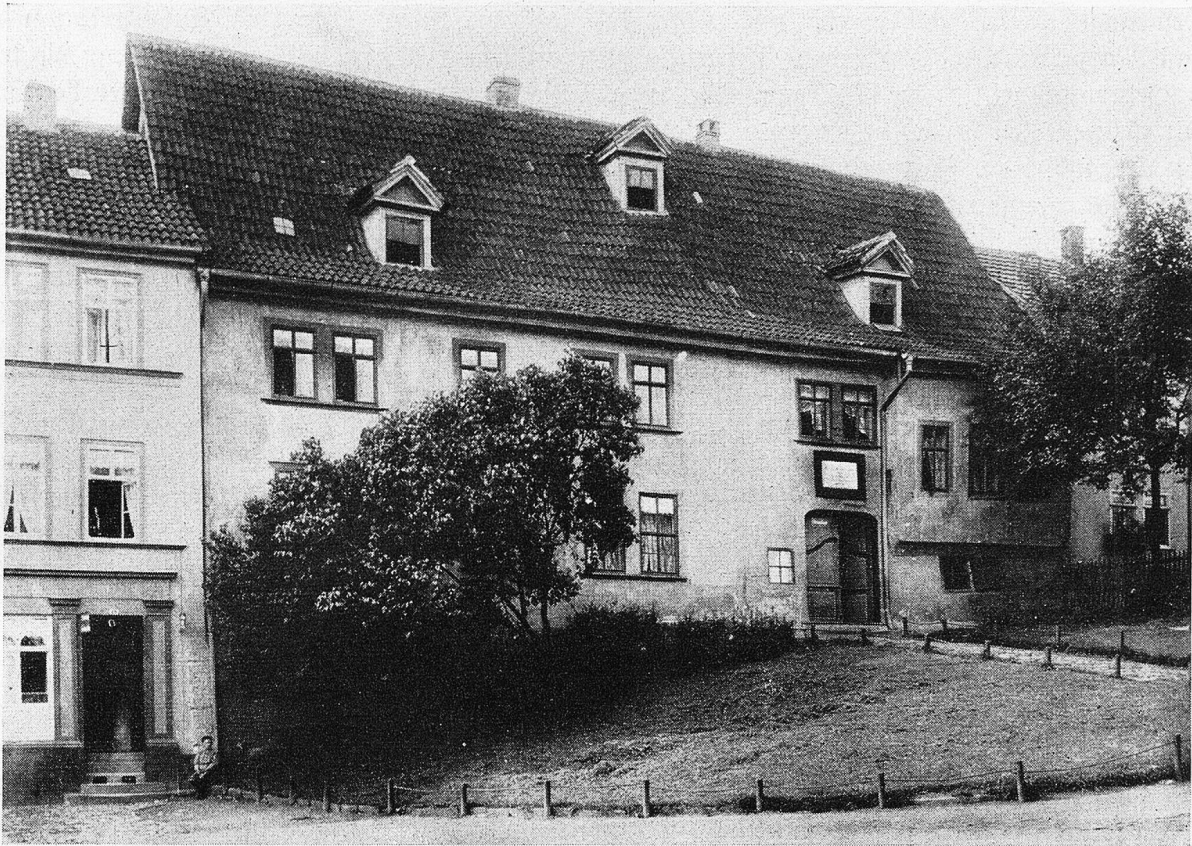
Das Geburtshaus Johann Sebastian Bachs in Eisenach.

fus Joh. Ambrosius Bach geboren. Deutschland hatte noch kaum die Schrecknisse des dreißigjährigen Krieges überstanden und war in drei religiöse Lager gespalten. Eine Reihe berühmter Ahnen trug den Namen durch alle deutschen Gaue, und der von Bach selbst angelegte und von seinem Sohn Philipp Emanuel fortgesetzte Stammbaum weist Organisten, Kantoren und Musiker in reicher Zahl auf, die alle in Thüringen heimisch waren. Unter den Verwandten herrschte stets reger Verkehr, und sie liebten es, an bestimmten Tagen zusammenzukommen, um ihre Angelegenheiten zu besprechen und sich an Musik und allerhand Kurzweil zu vergnügen.