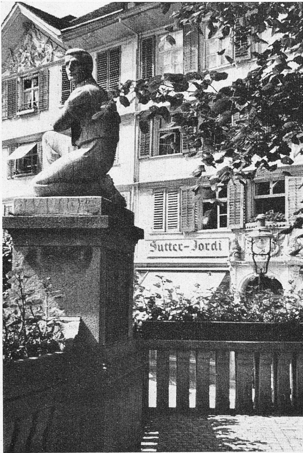
Herisau. Dieser stämmige Appenzeller auf mächtigem Steinsockel am historischen Dorfplatz ist den Wehrmännern des letzten Krieges gewidmet. Im Hintergrund ein wahrhaftes Bürgerhaus

vom Urquell der Berge singt das Ewigkeitslied in so manch graue Gasse einer alten geschichtsreichen Stadt!