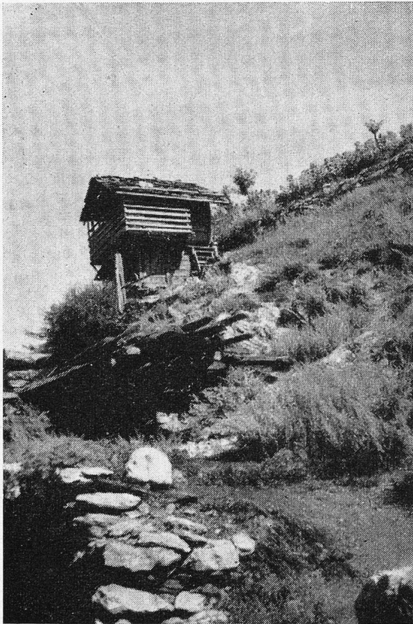
Die Häuser kleben oft tollkühn an den Felsen.

Das Wallis hat sein Privatklima, sonnig und trocken. Es paßt nicht hinein in die Norm der schweizerischen Meteorologie. Die mächtigen Gebirgsmauern im Norden und Süden sind die Ursachen dieses klimatischen Wunders. Die