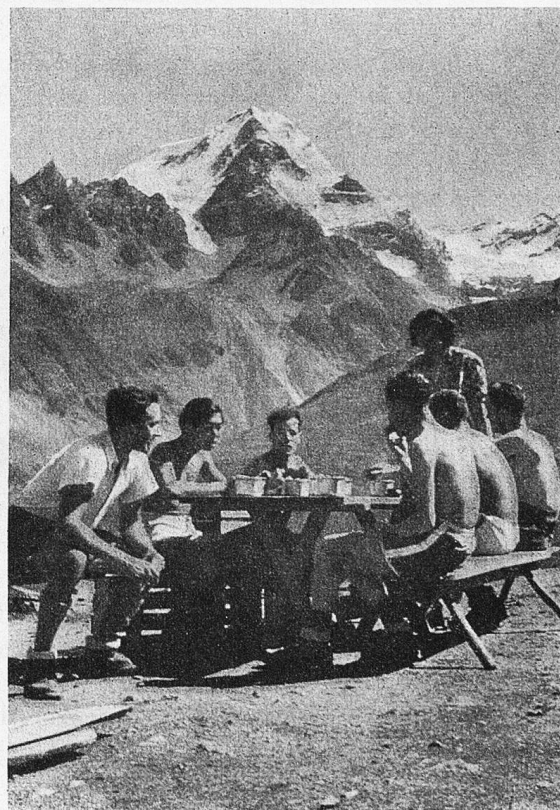
Selbst einfache Kost schmeckt herrlich nach getaner Arbeit.