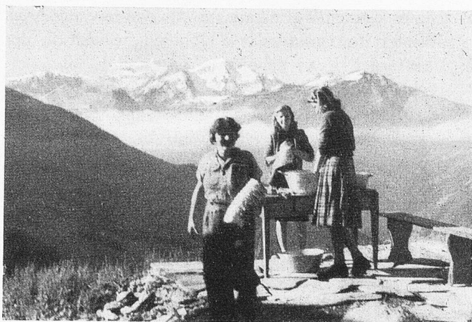
Waschtag auf luftiger Höhe.