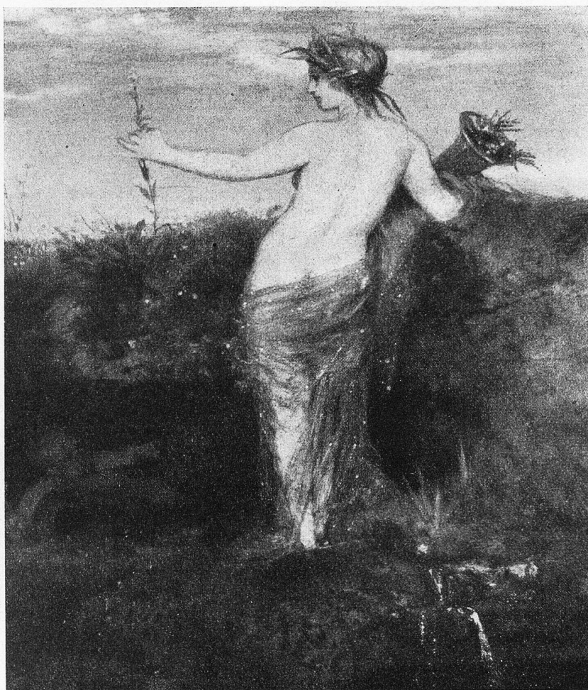
Arnold Böcklin: Quellnymphe mit Füllhorn

ler und seine Familie, denn Wedekind war mit der Ausführung nicht zufrieden — diese phantasiereichen Schöpfungen waren ihm zu fremdartig.