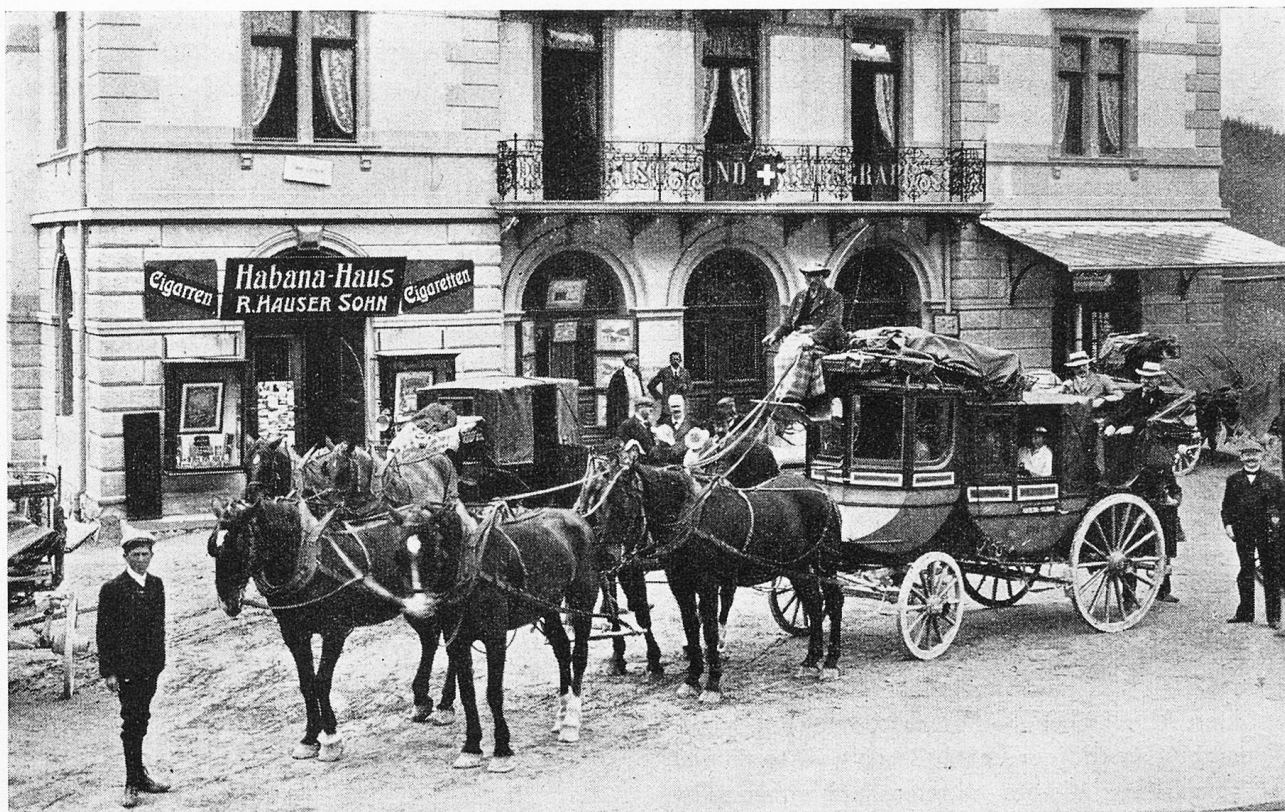
Berninapost in Pontresina ca. 1900