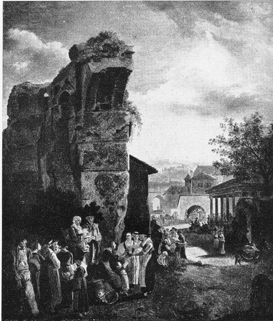
W. A. Töpffer: Strassensänger auf einem italienische Markte

den die künstlerischen Persönlichkeiten sind, so unterscheiden sie sich in der Ausprägung ihres Stils und in der Durcharbeitung ihrer Vorwürfe, und der Kenner sagt sich sogleich, ohne nach der Bezeichnung zu schauen: Das ist ein Anker! Das ist ein Böcklin. Oh diese Anker! Man bekommt nie genug von ihnen. Von welchem Liebreiz ist doch des Künstlers Töchterchen Luise! Diese