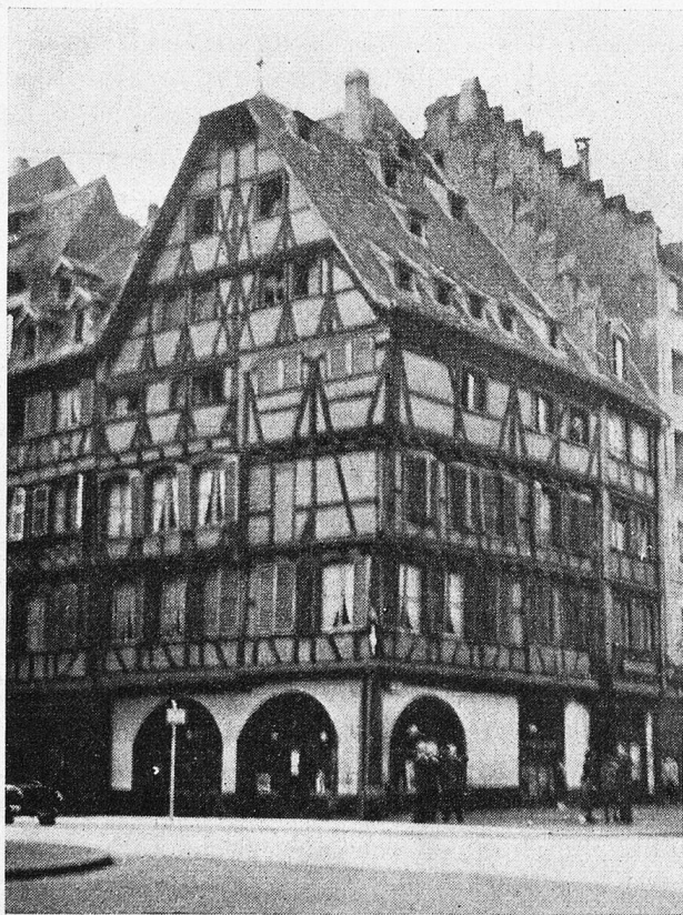
Die Fachwerkbauten geben der Altstadt das Gepräge

Kolmar war bald erreicht und weiter ging's in die elsässische Ebene. Aus dem herbstlichen Dunst grüssten verschwommen die Vogesen herüber. Unvermutet tauchte plötzlich ein Frachtschiff auf, das auf den zahlreichen, manchmal wirklich schmalen, kaum beachteten Kanälen fuhr. Als wir gar dem