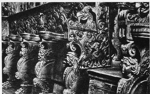
Ausschnitt aus dem Chorgestühl der Klosterkirche Wettingen