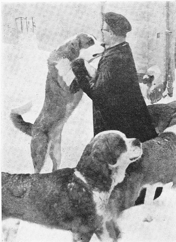
Mönch mit Bernhardinerhunden