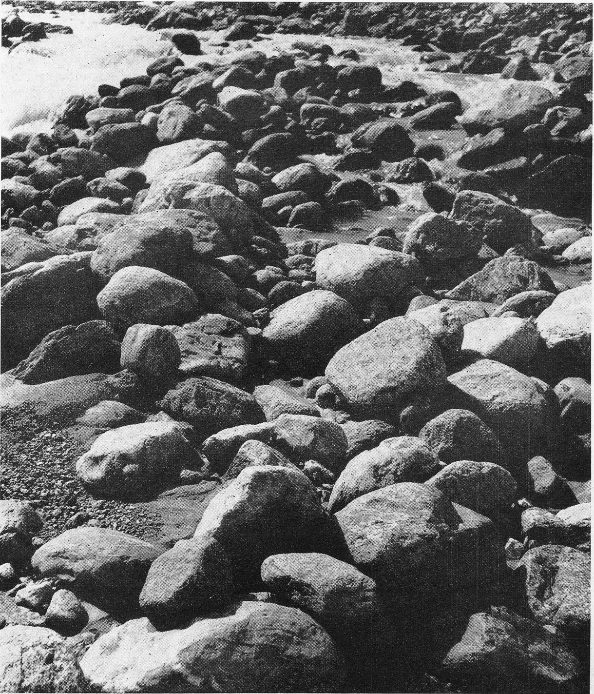
Flussbett der Borgne im Arollatal