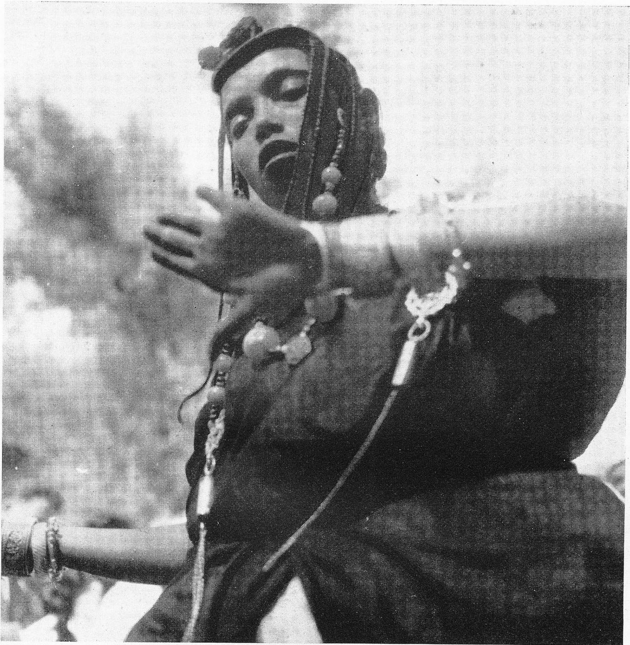
Beschwörung der Dämonen

Wenn schon im täglichen Leben die Scheidung zwischen dem «Ich» und der Umwelt häufig un- deutlich ist, so wird sie beim kultischen Tanz be- wusst aufgehoben. Die Tanzenden steigern sich in eine Ekstase, die — oft unter Anwendung von Rauschmitteln — in Trance übergeht. Man denke hier an die tanzenden Derwische.