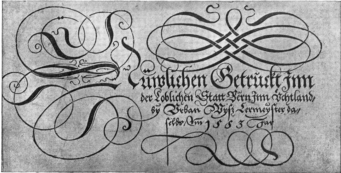
„Cantzly vnd Formular Buch“ des U. Wyss. Titel. (Bern. Stadtbibl. Litt. III, 8)