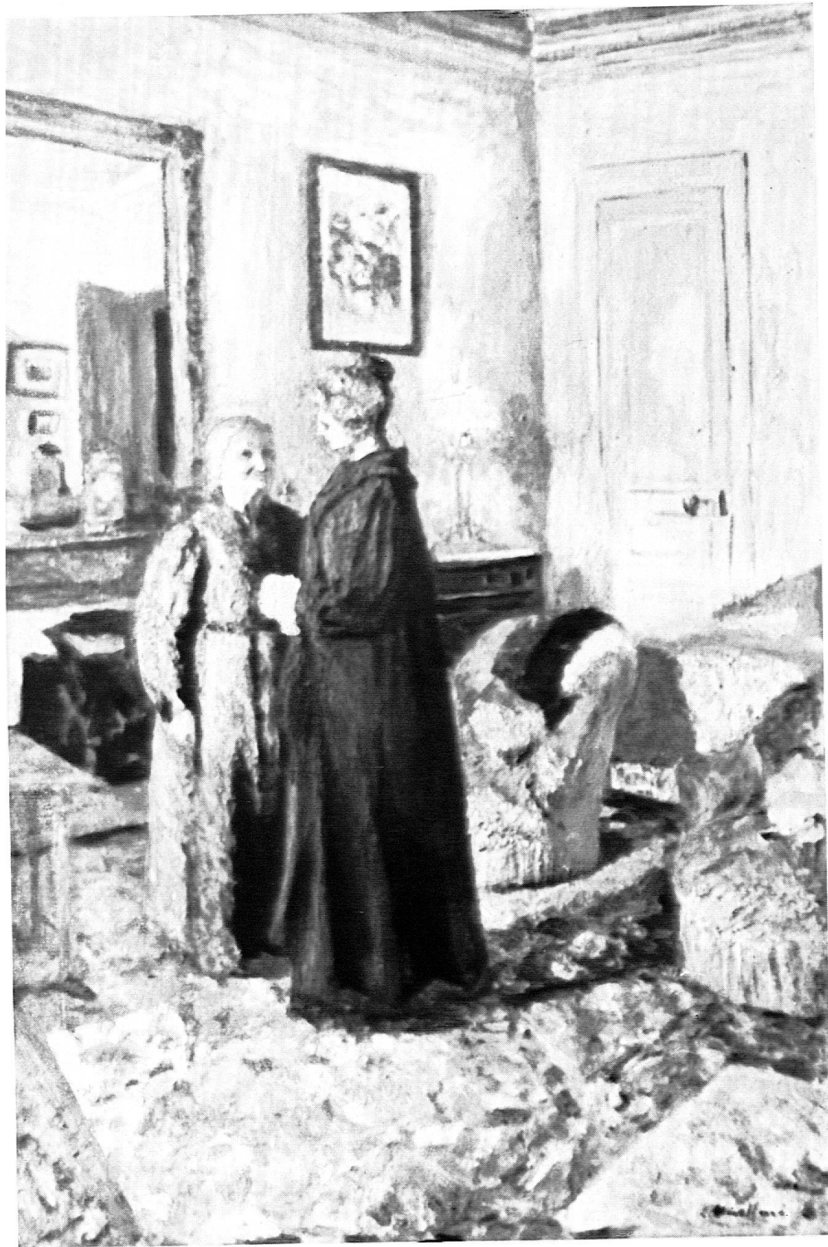
Ed. Vuillard - Au salon.