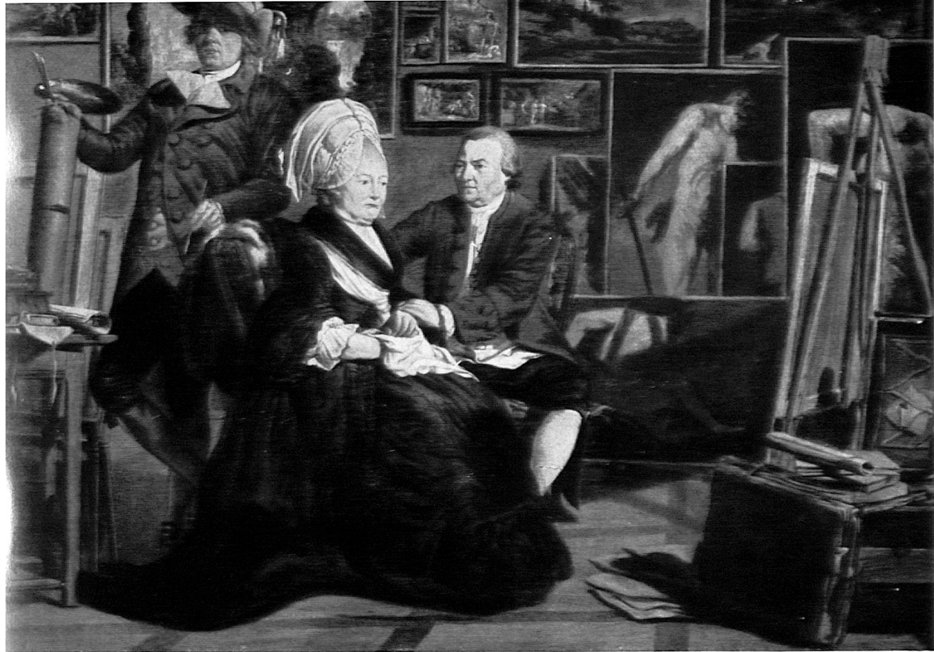
J. Sablet - Le peintre dans son atelier.

Ces 4 pages hors texte se rapportent à l'article «Le Musée et l'École», pp. 18-22.