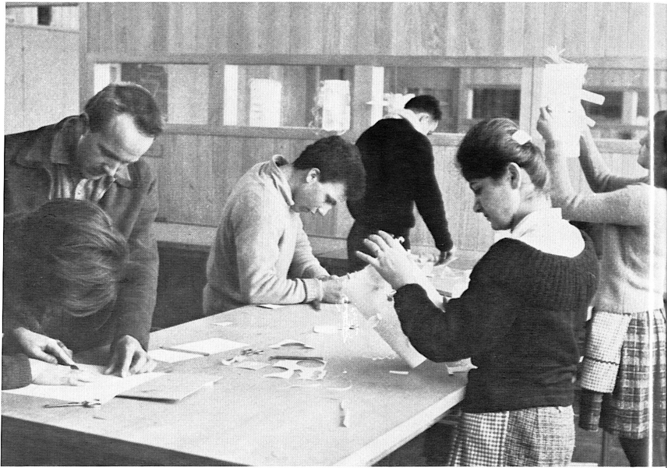
Travaux manuels à l'atelier de l'école secondaire.