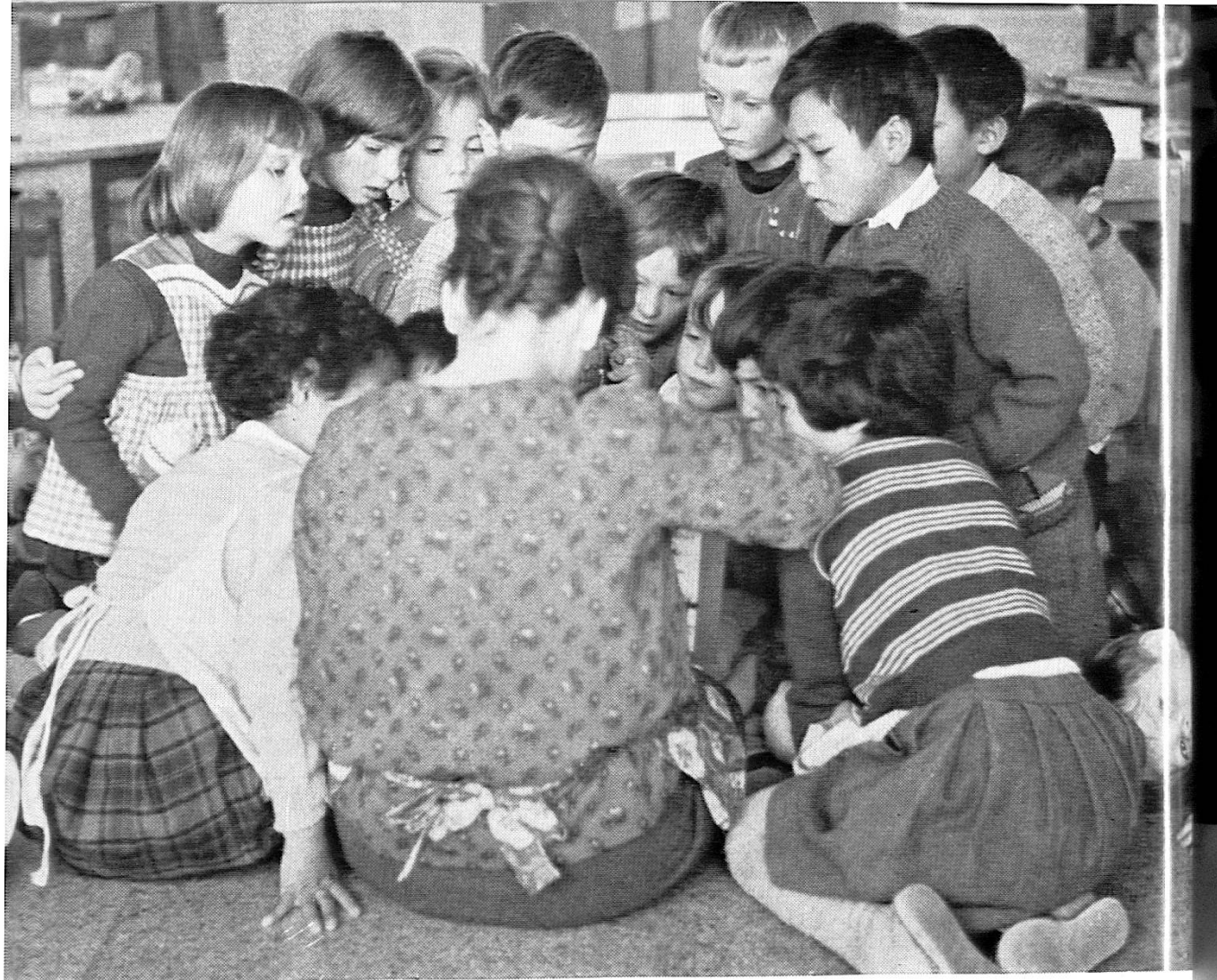
Le jardin d'enfants des tout petits.

Orchestre de la maison française « Les Cigales ». Les enfants ont construit eux-mêmes leurs xylophones.