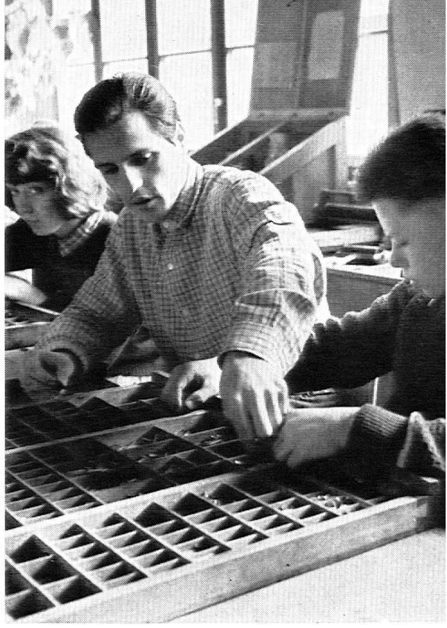
Les élèves des grandes classes à la composition du journal du Village « Amitié ».