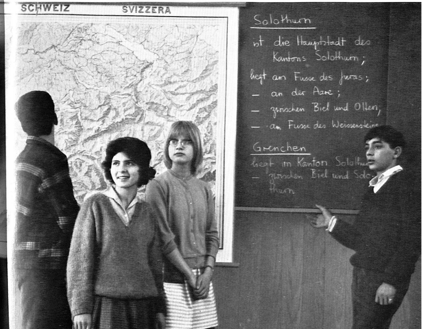
A l'école secondaire internationale.