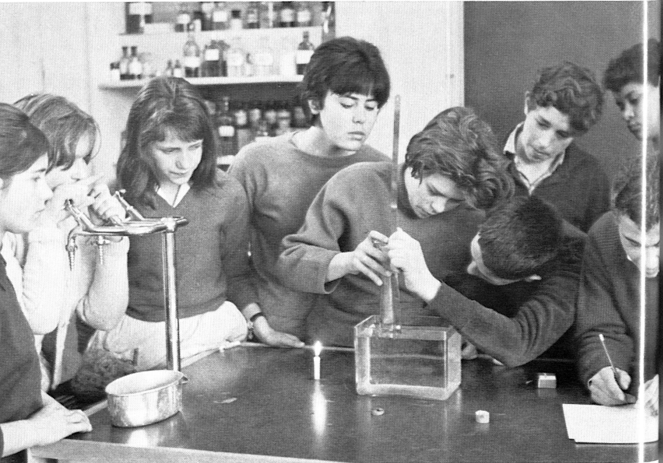
Les élèves de l'école secondaire font une expérience de physique.