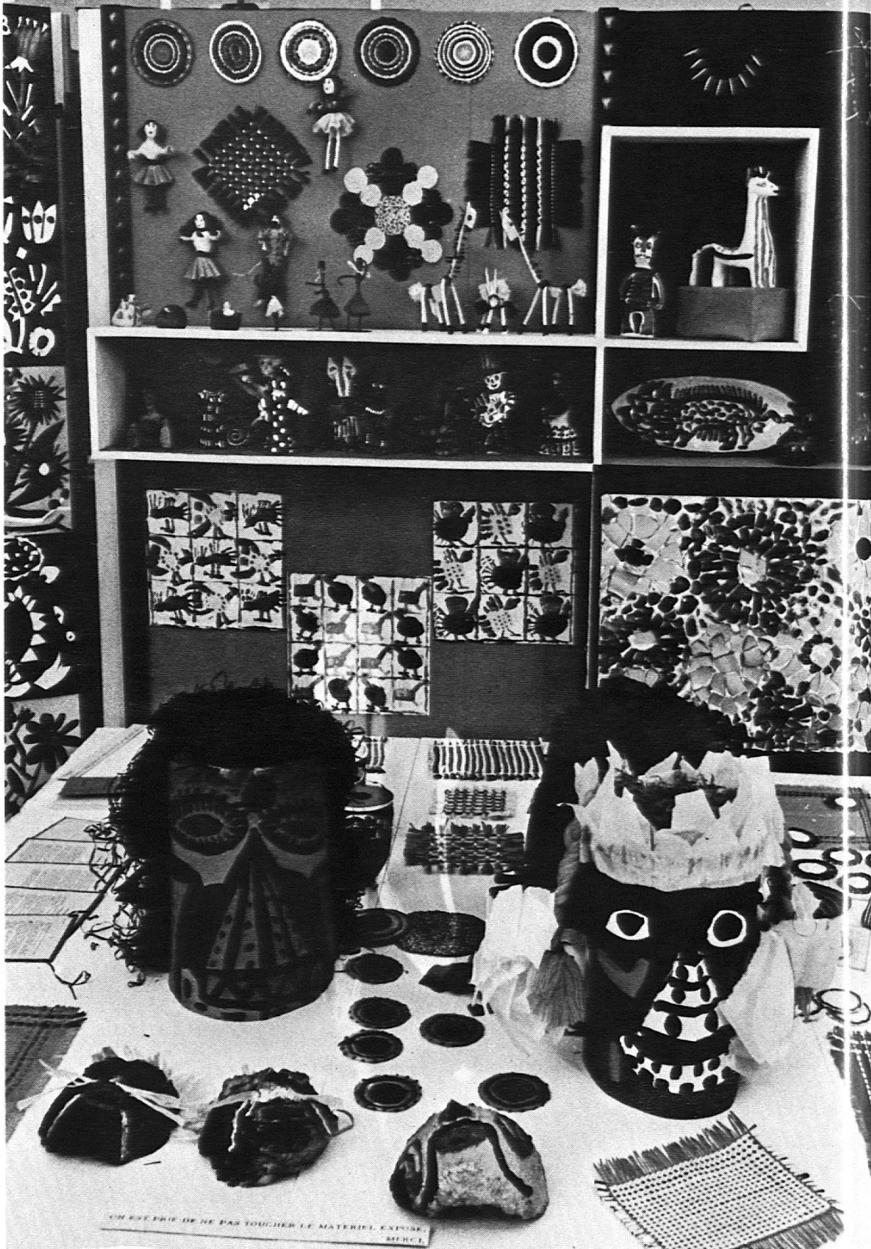
Des expositions périodiques illustrent l'activité artistique menée dans les classes.