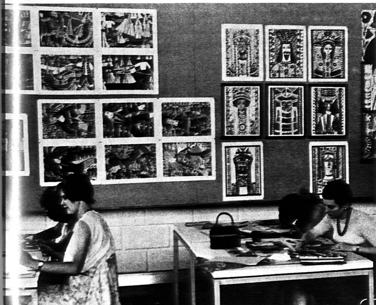
La formation nouvelle des enseignants fait appel à l'imagination plus qu'à l'imitation.