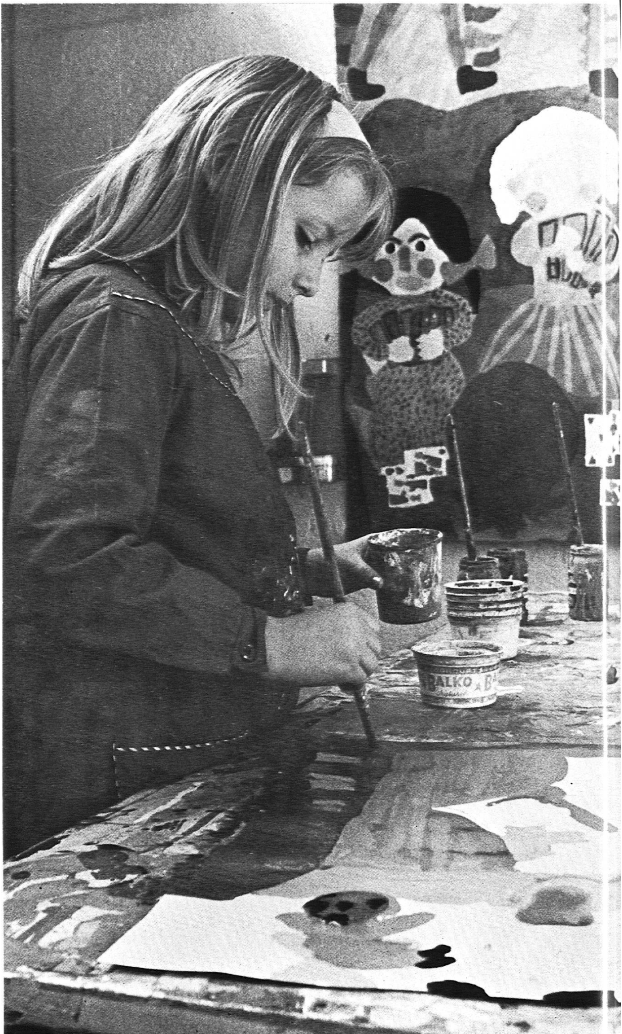
L'école sera d'autant plus créatrice qu'elle permettra de multiplier les activités diversifiées