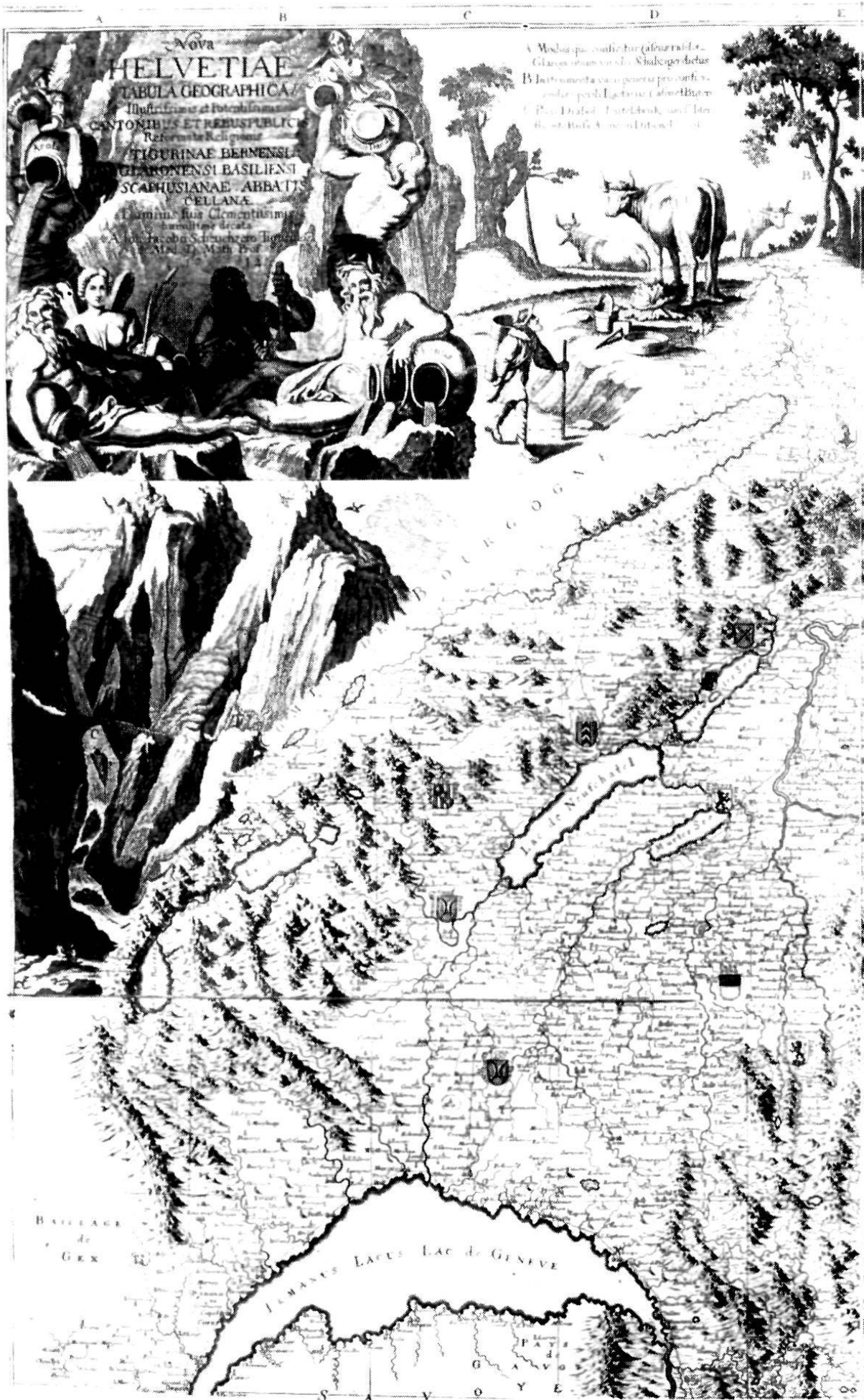
Teilansicht von Dr. Scheuchzers Nova Helvetiae tabula geographica, 1712