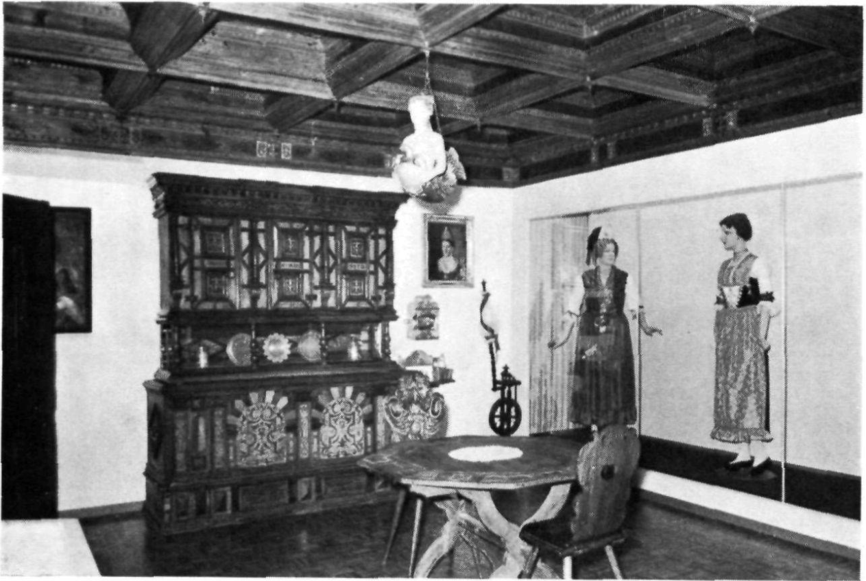
Appenzell, Heimatmuseum: Trachten- und Möbelstube