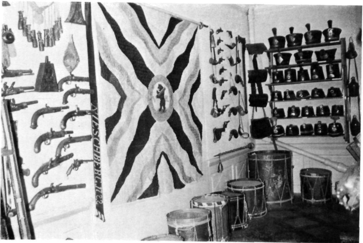
Herisau, Heimatmuseum: Ecke im Waffensaal