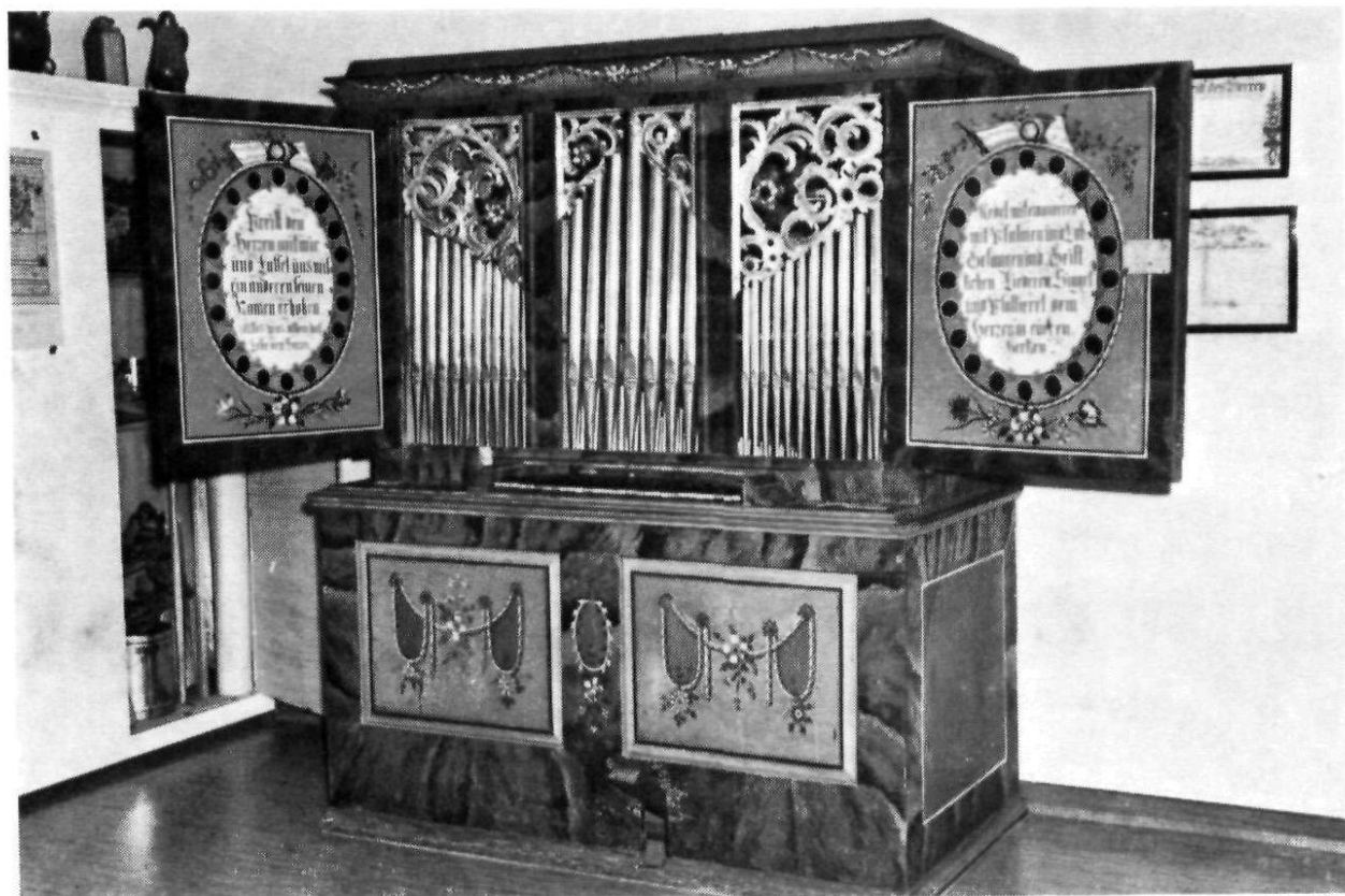
Heiden, Historisch-antiquarische Sammlung: Gemalte Appenzeller Hausorgel aus dem Jahre 1770