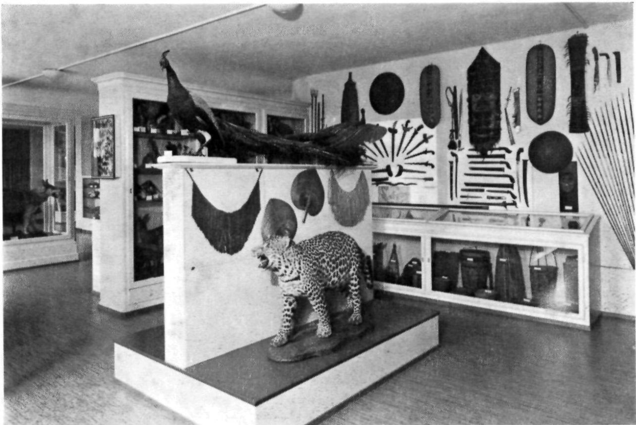
Heiden, Naturhistorische Sammlung: Blick auf ethnographische Abteilung aus Sumatra