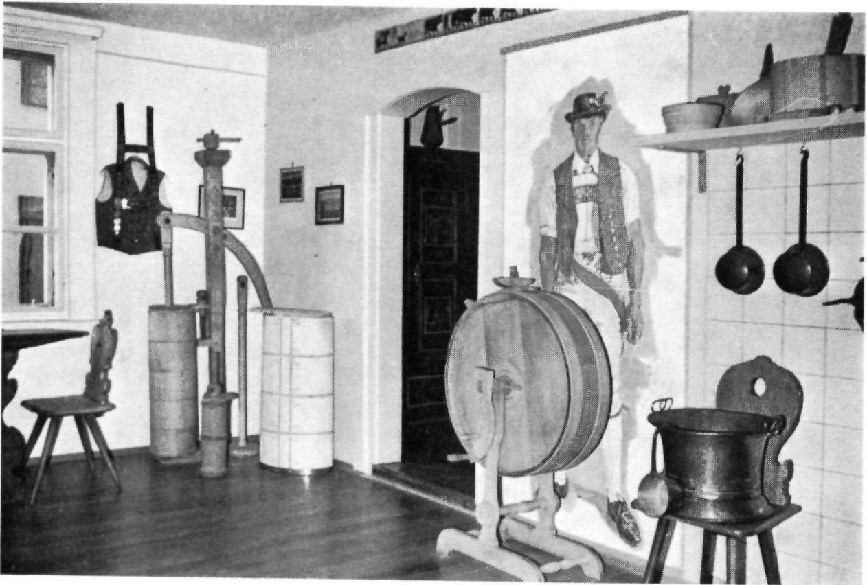
Herisau, Heimatmuseum: Sennereizimmer