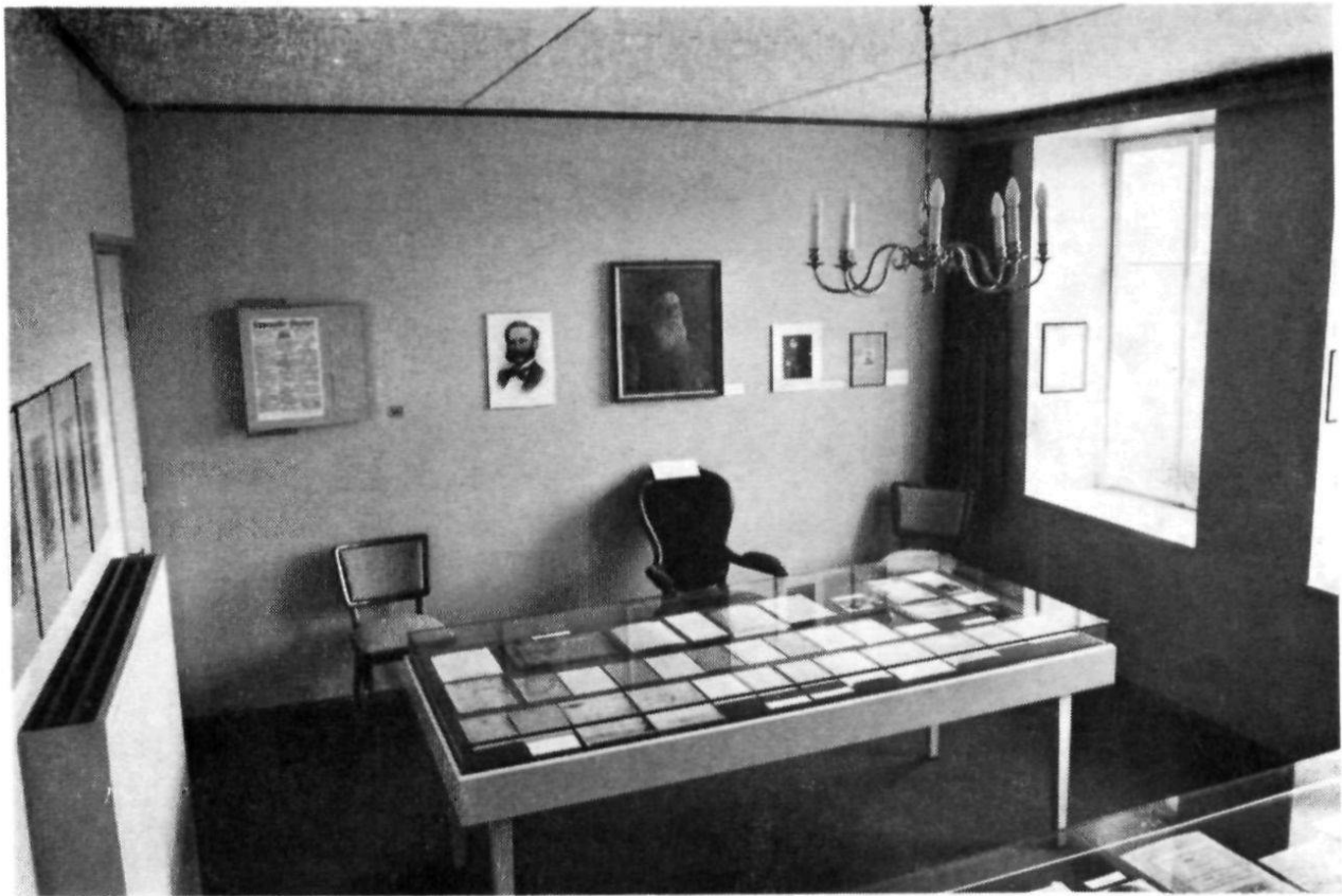
Heiden, Alterspflegeheim: Henri-Dunant-Museum