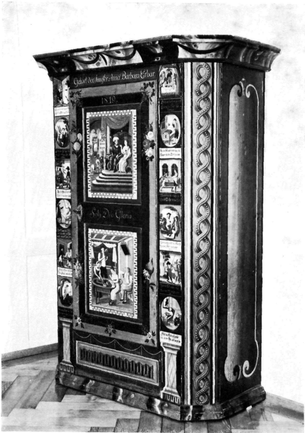
Herisau, Heimatmuseum: Gemalter Kasten aus Stein AR von 1819