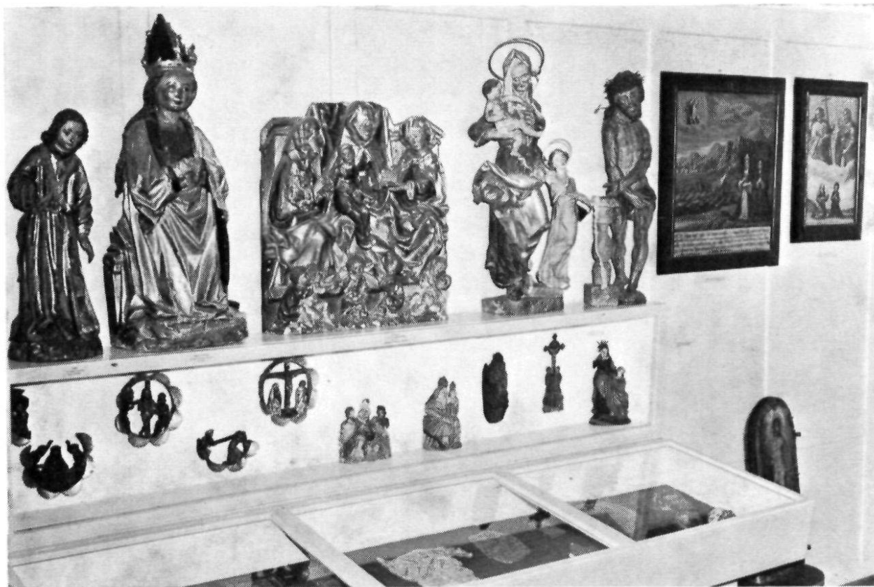
Appenzell, Heimatmuseum: Votivtafeln und kirchliche Plastiken