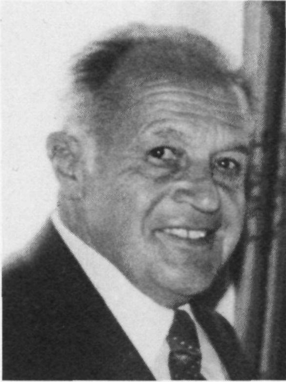
Landeshauptmann Johann Koch, Gonten (1915—1982)