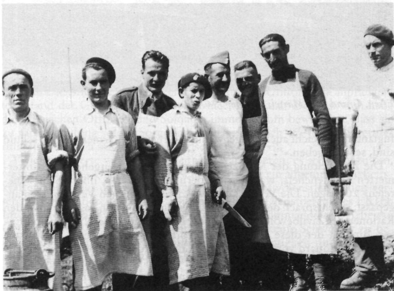
Küchenmannschaft, Grand Som Martel, Sommer 1941. (Rucki)

«Selbst einer unserer kulturell hochstehenden Divisionskommandanten klagte wiederholt, dass die Internierten teilweise in Betten schliefen, während unsere Soldaten auf dem Stroh liegen müssen, und übersah ganz, dass wir unsere Soldaten gewollt zur Härte erziehen und dass unsere Soldaten nach einer kurzen Ablösung wieder daheim in ihren Betten schlafen, während wir darnach trachten sollten, den Internierten, die für viele Monate, sogar teilweise mehrere Jahre unsere Gastfreundschaft in Anspruch nehmen müssen, ihr hartes Los möglichst erträglich zu gestalten. Dass am Entstehen der obenerwähnten missgünstigen Stimmung eine Anzahl Re-