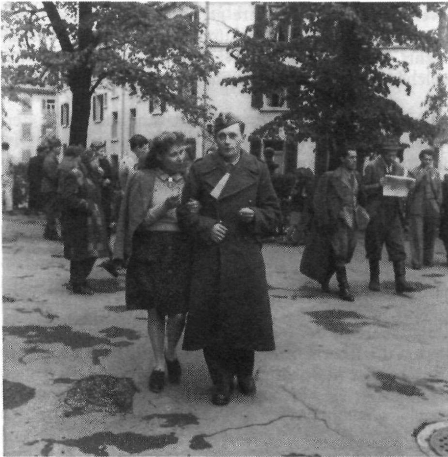
Schweizerin und polnischer Internierter. «Veröffentlichung verboten. Abteilung Presse und Funkspruch.» (BAr)

und Hospitalisierung (EKIH), das am 18. Juni 1940 gegründet und dem Armeestab unterstellt wurde, improvisierte vorweg. Es gab allgemeine Dienstbefehle heraus, deren Rechtsgrundlage der Bundesrat nachträglich sicherte. Diese Grundbefehle blieben mehrheitlich bis Kriegsende in Kraft. Sie sollten die Aufgabe des EKIH unterstützen, nicht nur die Internierten zu bewachen, zu ernähren und gesundheitlich zu versorgen, sondern auch ihre geistigen und sportlichen Bedürfnisse, ihre Aus- und Weiterbildung zu decken sowie ihnen Arbeit zu beschaffen. Seit Winter 1944 unterstand das EKIH ein Jahr lang dem Militärdepartement. Die Armee war Ende 1945 für die Auflösung zuständig, während sich die Polizeiabteilung des Justizdepartementes um die Heimkehrverweigerer kümmerte.