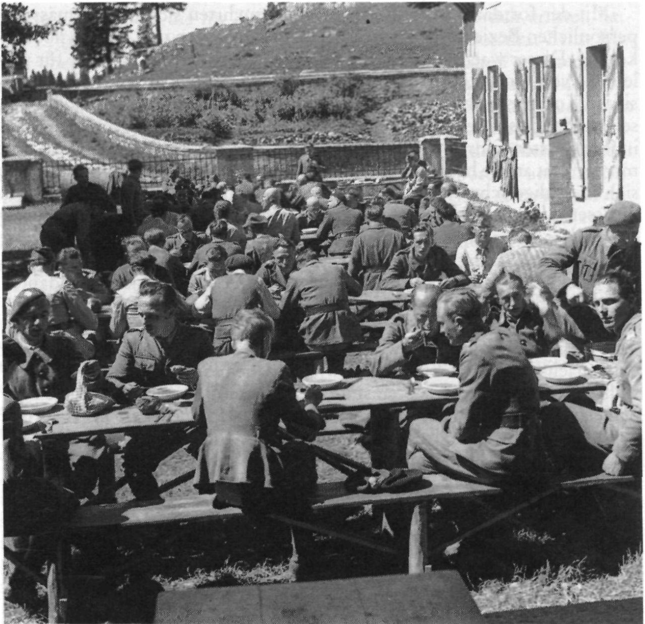
Essen, Grand Som Martel, Sommer 1940. (Rucki)

fugianten, vielleicht auch einige, wenig zahlreiche, Internierte selbst schuld sind, sei zugegeben.» 31)