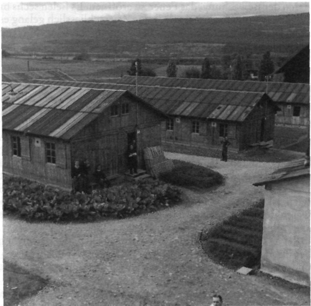
«Concentrationslager» Büren an der Aare.

Kurz nach Weihnachten weihte viel Prominenz das Grosslager ein, in dem sich über 2000 Polen aufhielten. Am 28. Dezember 1940 wechselte die Wachmannschaft. Einen Tag später notierte der Schweizer Wachkomman-