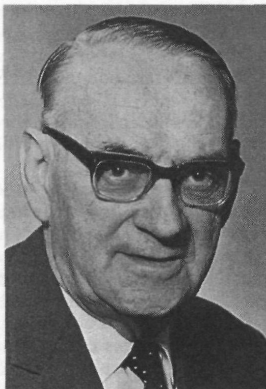
Carl Lutz (1895–1975).

In äusserst schwierigen Zeiten hatte sich Vizekonsul Carl Lutz nicht nur für seine Landsleute im In- und Ausland eingesetzt, er spielte als Diplomat in Budapest eine geradezu zentrale Rolle, als es darum ging, Zehntausende von Juden zu retten, die in Konzentrationslager abgeschoben oder direkt dem schrecklichen Schicksal der Vernichtung in Gaskammern der Nazis ausgesetzt waren.