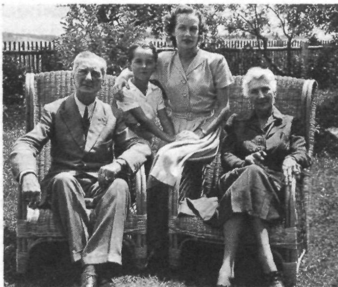
Die Familie des ehemaligen ungarischen Admirals und Staatsmannes Niklaus Horthy im Exil in Weilheim/Bayern.

1947 besuchte ihn Carl Lutz im Schloss Hirschberg und führte mit dem ehemaligen Reichsverweser ein langes Gespräch. Bei dieser Gelegenheit machte Lutz von der Familie im Garten eine Aufnahme. Im Laufe der langen Unterredung stellte es sich heraus, dass Horthy gar nicht auf den Gedanken kam, dass seine Politik des Duldens und sogar Unterstützens der engen Bindung Ungarns an Faschismus und Nationalsozialismus verhängnisvoll gewesen war. Noch nach so vielen Misserfolgen, nachdem seine Offiziere zu Hochverrätern geworden waren, nachdem die Deutschen seinen Sohn verschleppt und ihn ins KZ nach Mauthausen bringen lassen und ihn selbst verhaftet hatten, glaubte er keine andere Wahl in der ungarischen Politik gehabt zu haben.