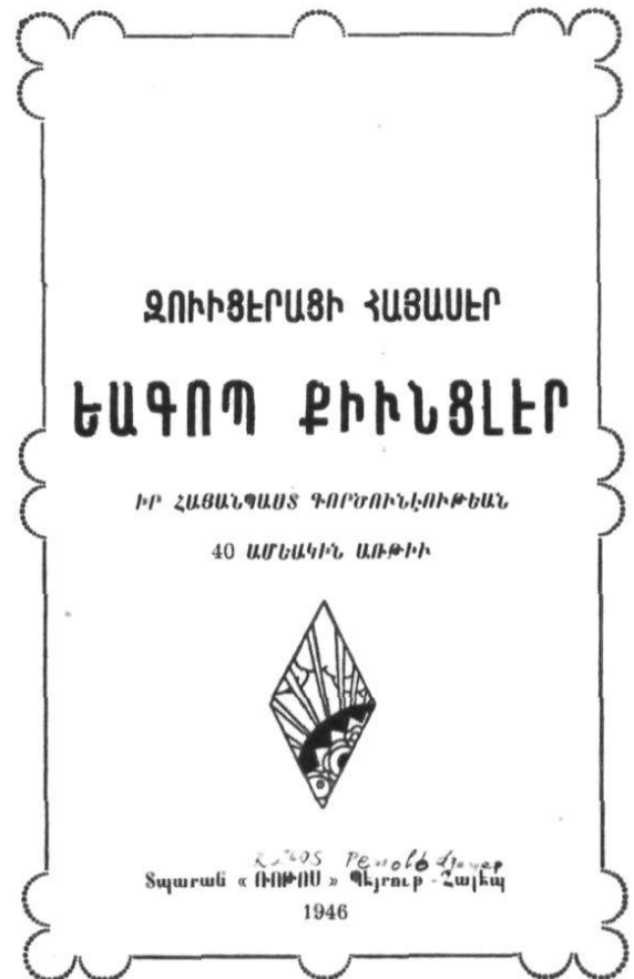
Titelblatt des Erinnerungsbuches in armenischer Schrift.

In der Heimat, die eigentlich wenig über ihren wahrhaft tatkräftigen Mit- eidgenossen und seine grossartigen, humanitären Leistungen wusste, erschien sein Bild mit einer entsprechen- den Legende im «Echo für Auslandschweizer» an einem bevorzugten Platz.