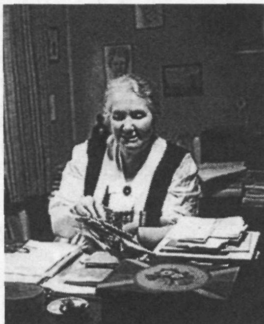
Gertrud Kurz (1890–1972).

Frau Gertrud Kurz stand und steht noch heute in vorderster Front derer, die den Flüchtlingen nicht nur materielle, sondern auch geistige Hilfe zuteil werden lassen. Unzählige Flüchtlinge haben die Wohltat ihrer grossen Güte und ihres