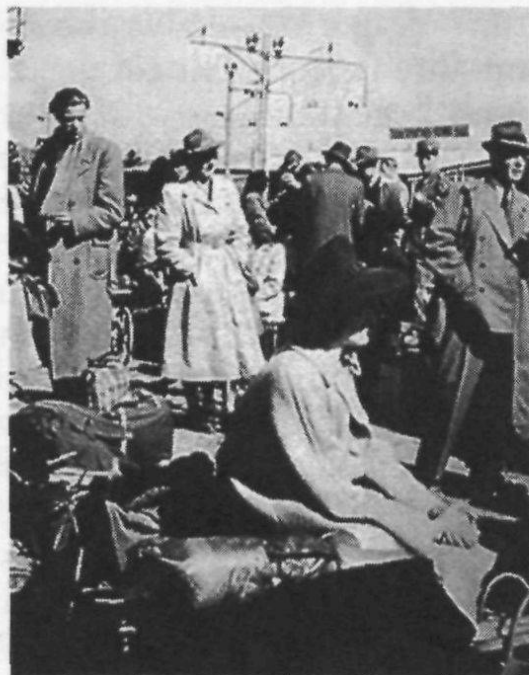
Anreisende Flüchtlinge nach Kriegsende.