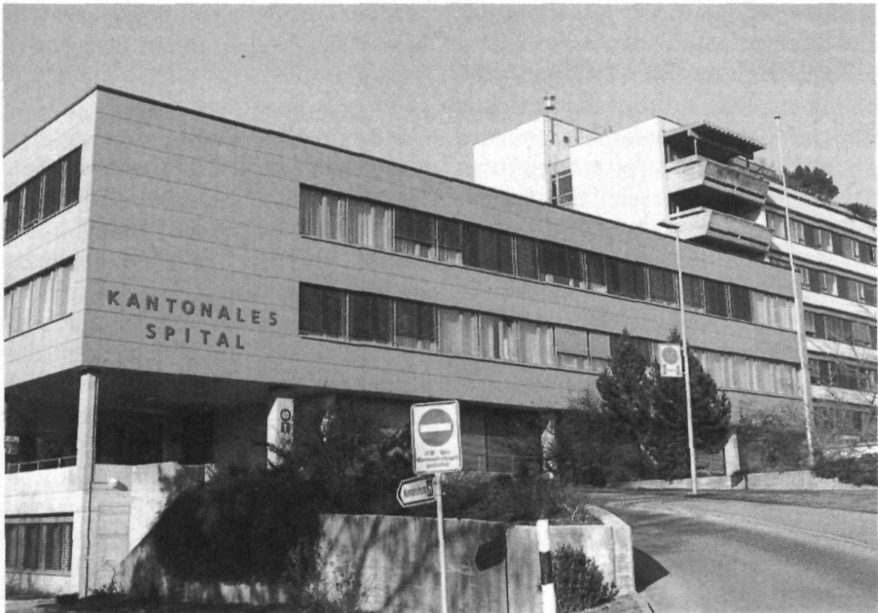
Nach der etappenweise erfolgten Erneuerung konnten die kantonalen Spitäler in Herisau (Bild) und Heiden eingeweiht werden.

die stets arbeitsintensiven arbeitsrechtlichen Streitigkeiten und auch die ebenfalls aufwendigen Eheschutzmassnahmen.