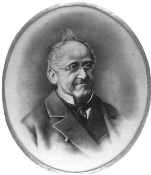
Fotoporträt von Bundeskanzler J. U. Schiess, um 1870.

Als Vorsteher der Bundeskanzlei hatte Schiess ohne technische Hilfsmittel und mit bloss einem Dutzend Angestellter ein ungeheures Pensum zu bewältigen. Zu seinen Hauptaufgaben gehörte die Protokollführung im Bundesrat sowie im Nationalrat. Daneben besorgte Schiess die Redaktion des Bundesblattes und der eidgenössischen Gesetzessammlung. Zudem war die Bundeskanzlei mit dem Sekretariat des jeweils vom Bundespräsidenten geleiteten Eidgenössischen Politischen Departementes betraut. Auf diplomatischem Parkett konnte der Bundeskanzler wiederholt an internationalen Missionen teilnehmen,