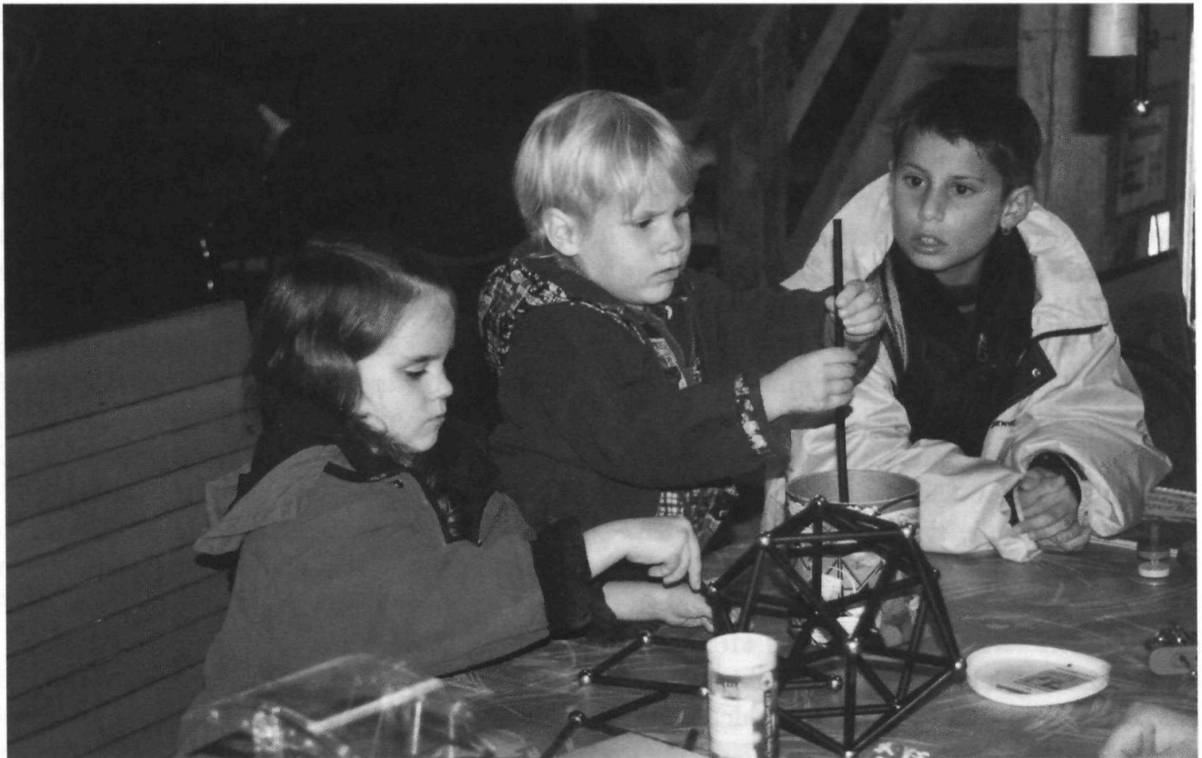
Die Ausstellung «Pfeff ond Lisch» weckte die Neugier bei Gross und Klein und hielt Raum frei, sich im vernetzten Denken zu versuchen.