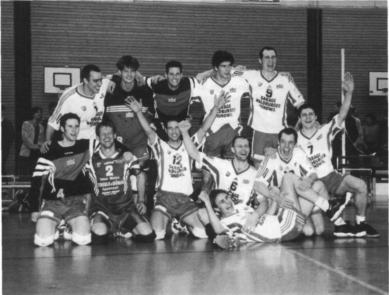
Der Volleyballclub Gonten schaffte mit dem Team Herren 1 den Schweizermeistertitel in der Nationalliga B und damit den Aufstieg in die NLA.