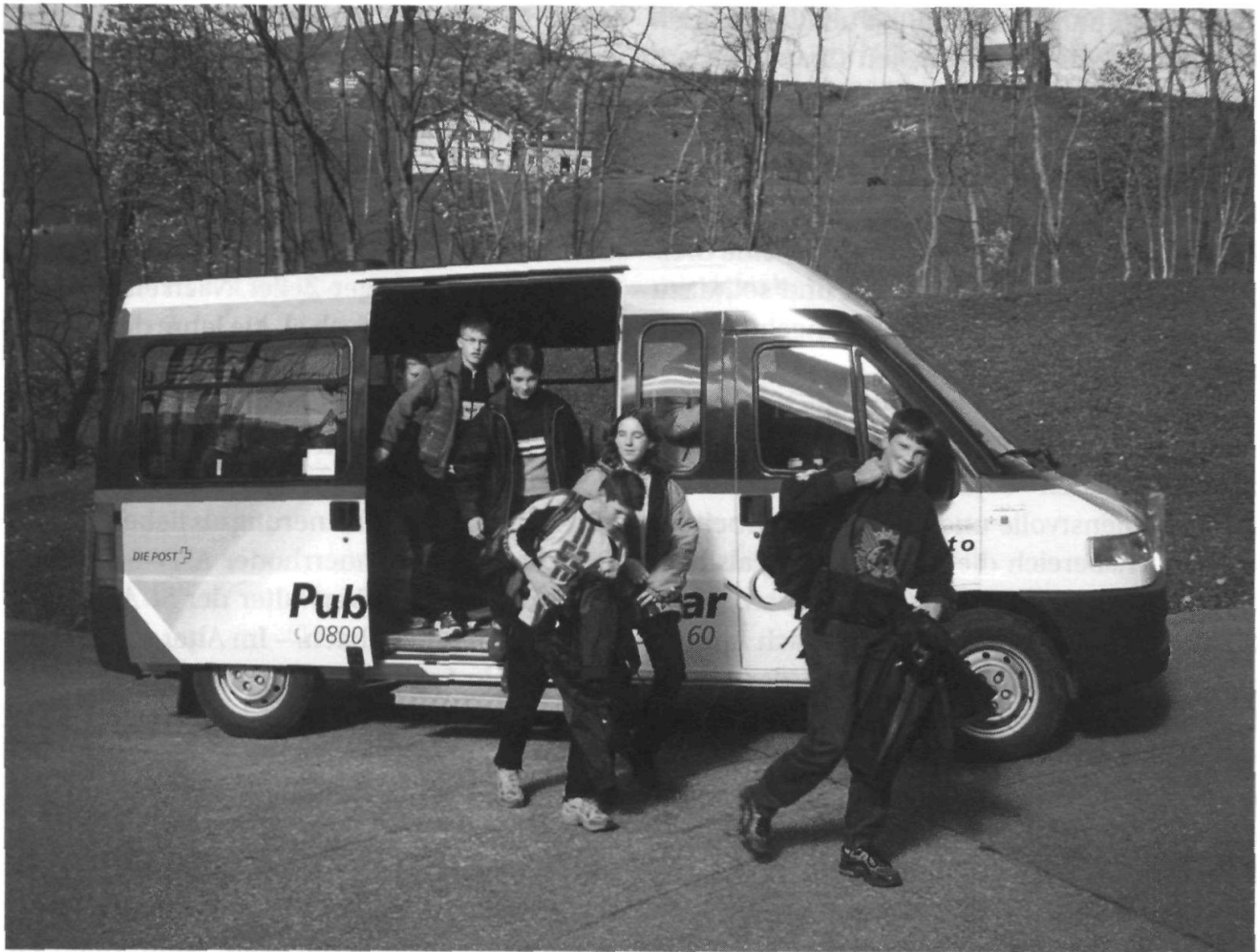
Der neu geschaffene Rufbus PubliCar fand schnell Kundschaft bei den Schülern sowie den Bewohnern abseits der öffentlichen Verkehrsströme.