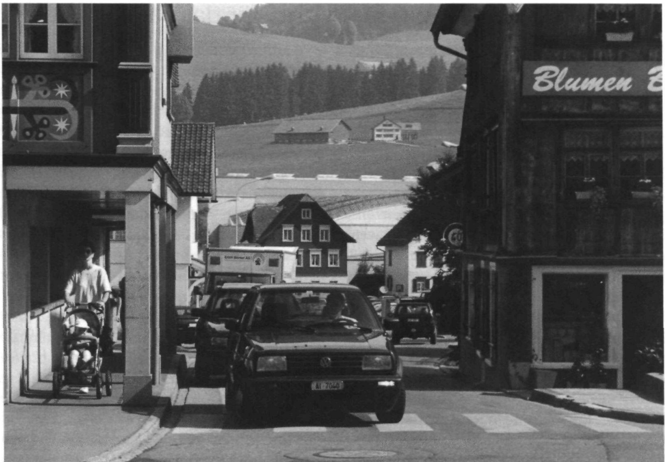
Ein Jahresthema, Dorfverschönerung und Verkehrsführung: Soll der Engpass beim Hotel Säntis am Landsgemeindeplatz zur Einbahn werden oder dient er gerade einer vernünftigen Temporegulierung?

kommen zwischen der Schweizerischen Eidgenossenschaft einerseits und der Europäischen Gemeinschaft sowie gegebenenfalls ihren Mitgliedstaaten oder der Europäischen Atomgemeinschaft andererseits (Bilaterale Verträge): 2421 Ja, 2246 Nein.