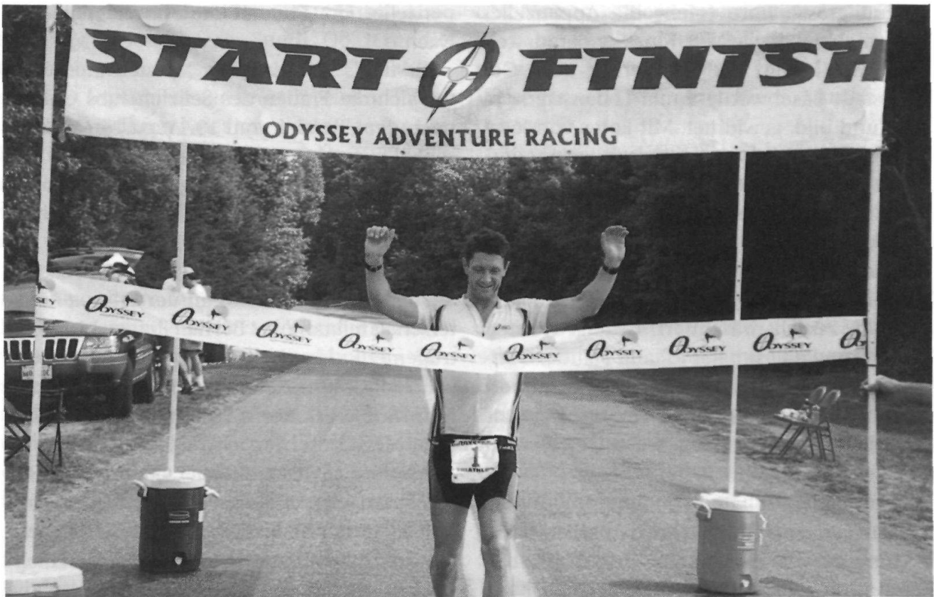
Mit der Distanz von 27 Ironman-Triathlon Eingang ins Guinness-Buch der Rekorde gefunden: Beat Knechtle.

Zeit) in Prêles oberhalb Twann den 2. Rang erkämpfte.