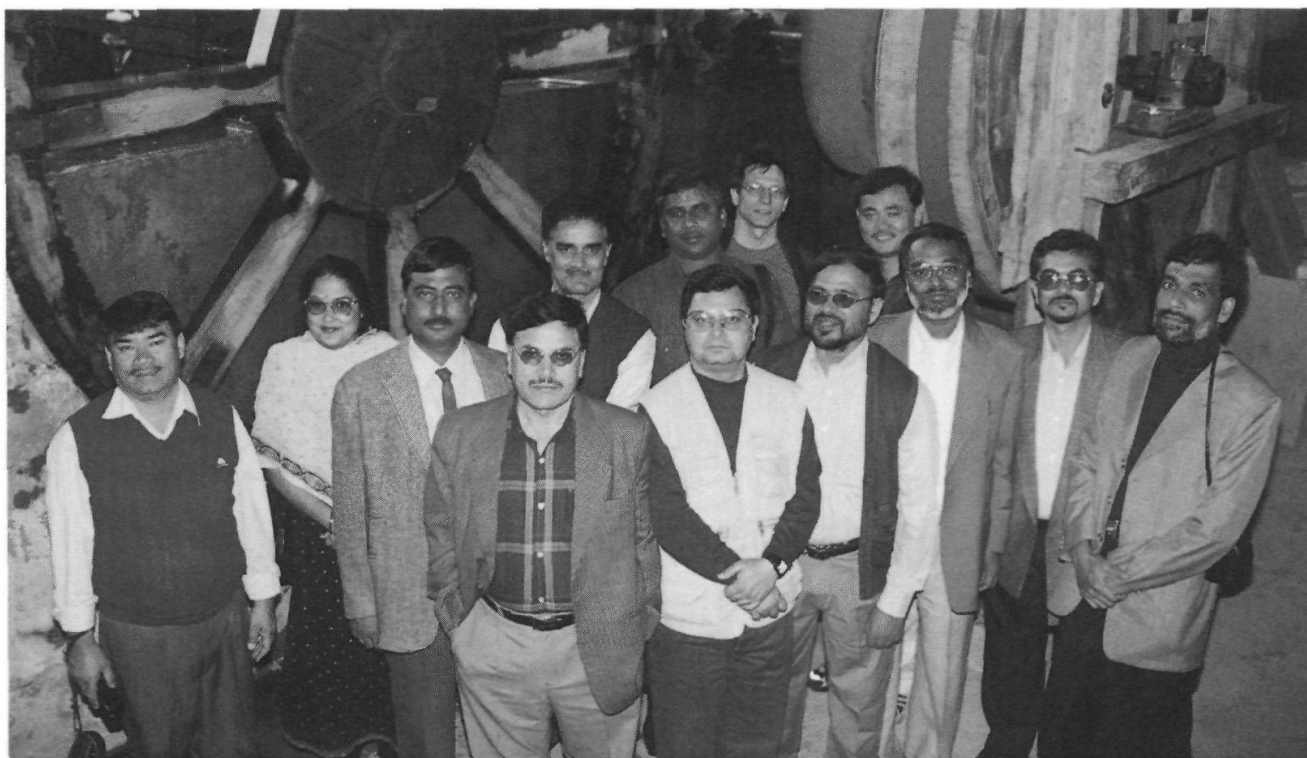
Das bei der Hofersäge in Appenzell restaurierte und zur Elektrizitätsgewinnung wieder in Betrieb genommene Wasserrad findet weit über die Landesgrenzen hinweg Interesse.