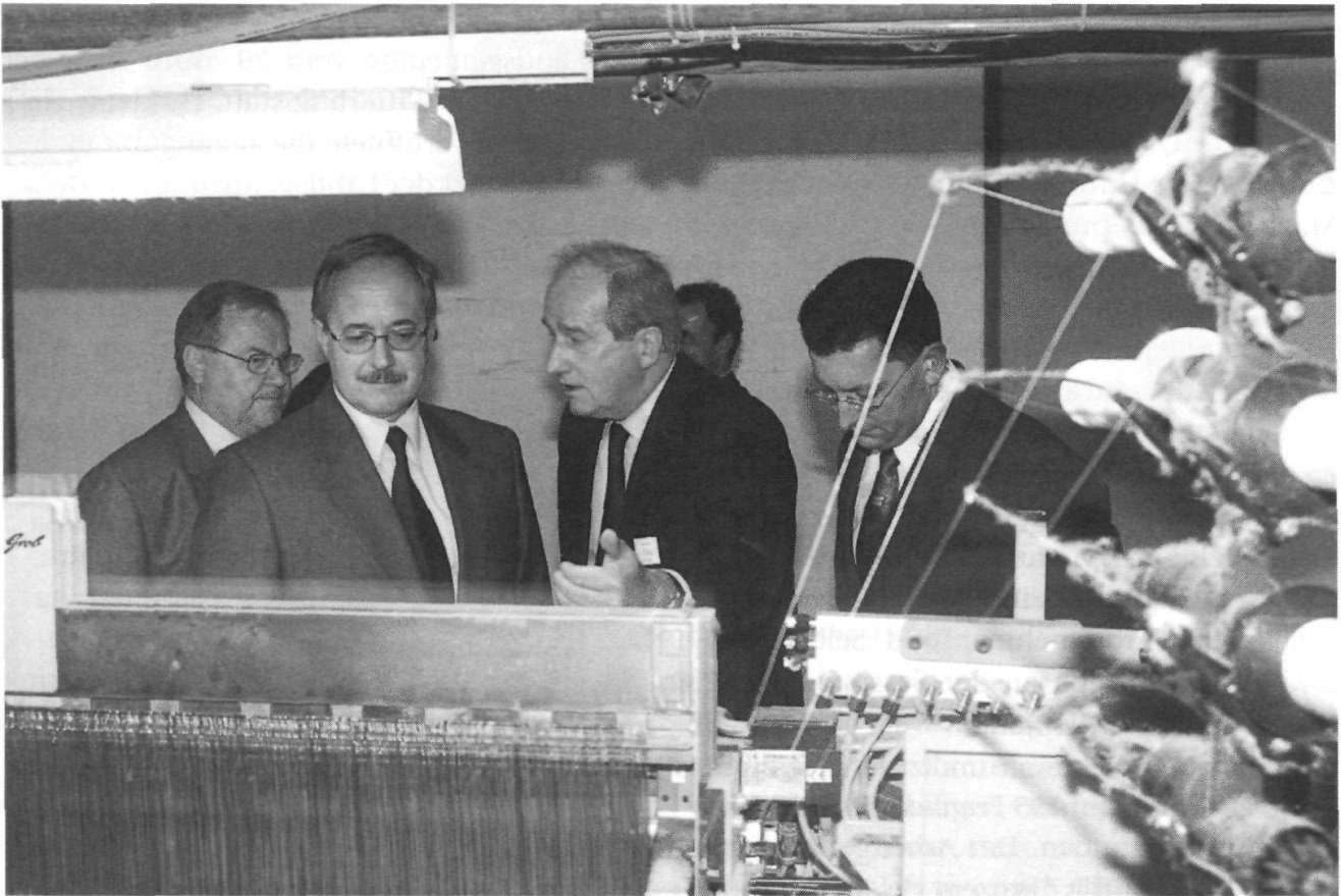
Bundesrat Samuel Schmid (vorne links) in der Weberei der alba-Gruppe.