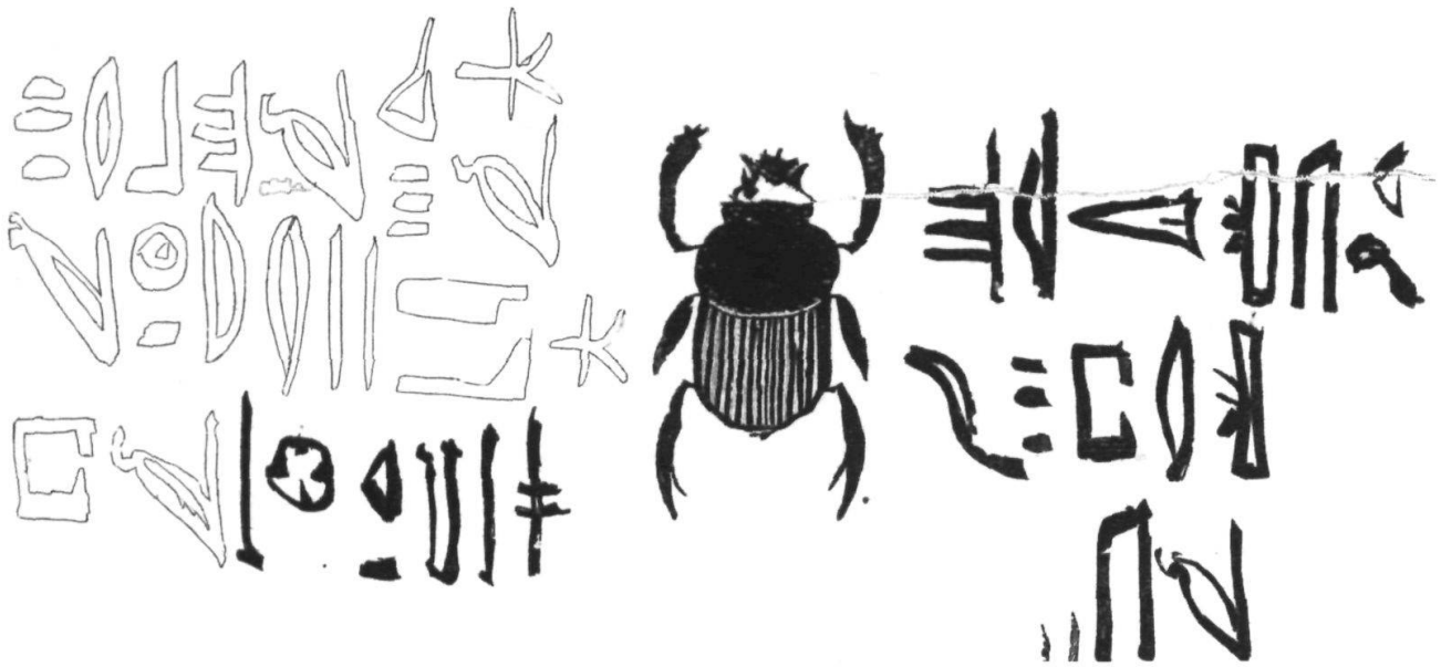
Hieroglyphen und Skarabäus auf einer Papyrusrolle (Ausschnitt).

sidenten, die Jahresrechnungen und Revisorenberichte sowie die Jahresberichte derjenigen Institutionen, die dem Patronat der AGG unterstellt sind. Besonders hinzuweisen ist auf jene Seite, welche die neu eingerichtete Homepage der AGG ( www.aggesellschaft.ch ) vorstellt. Im Anhang befinden sich die Appenzeller Bibliographie für das Jahr 2002, der Bildnachweis sowie das Autorenverzeichnis.