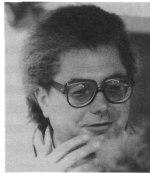
bild prägenden Themenkreis wissenschaftlich auseinandergesetzt hat. Gleichberechtigt daneben stand der Blick über den Bodensee, weg vom Alpstein, in die Ferne schweifend und seit alters her Öffnung bezeichnend. Landschaft, Literatur und den Gegensatz von Projektion und Wirklichkeit versuchte er auszuloten. Seine als Forscher produktivste Phase fällt in die Jahre 1979 bis 1985.