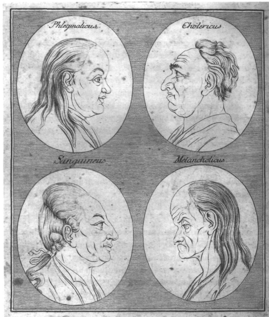
Die Darstellung der vier Temperamente bei Johann Caspar Lavater (1741–1801), Physiognomische Fragmente zur Beförderung der Menschenkenntnis und Menschenliebe , aus dem Jahre 1775.