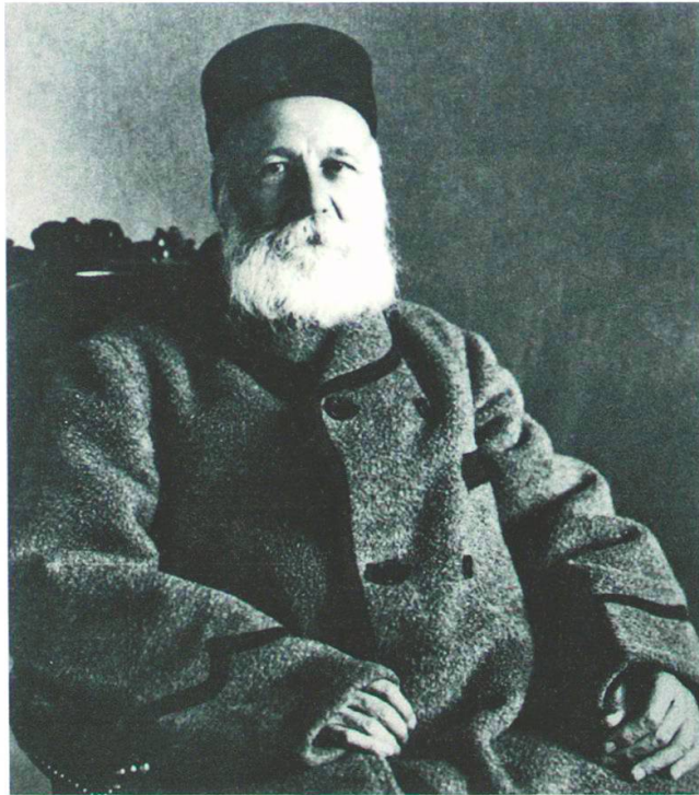
JOHANNES HEINRICH DUNANT DER SAMARITER VON SOLFERINO BEGRÜNDER DES ROTEN KREUZES UND URHEBER DER GENFER KONVENTION.

«Der Held Dunant» in unserer Erinnerung.