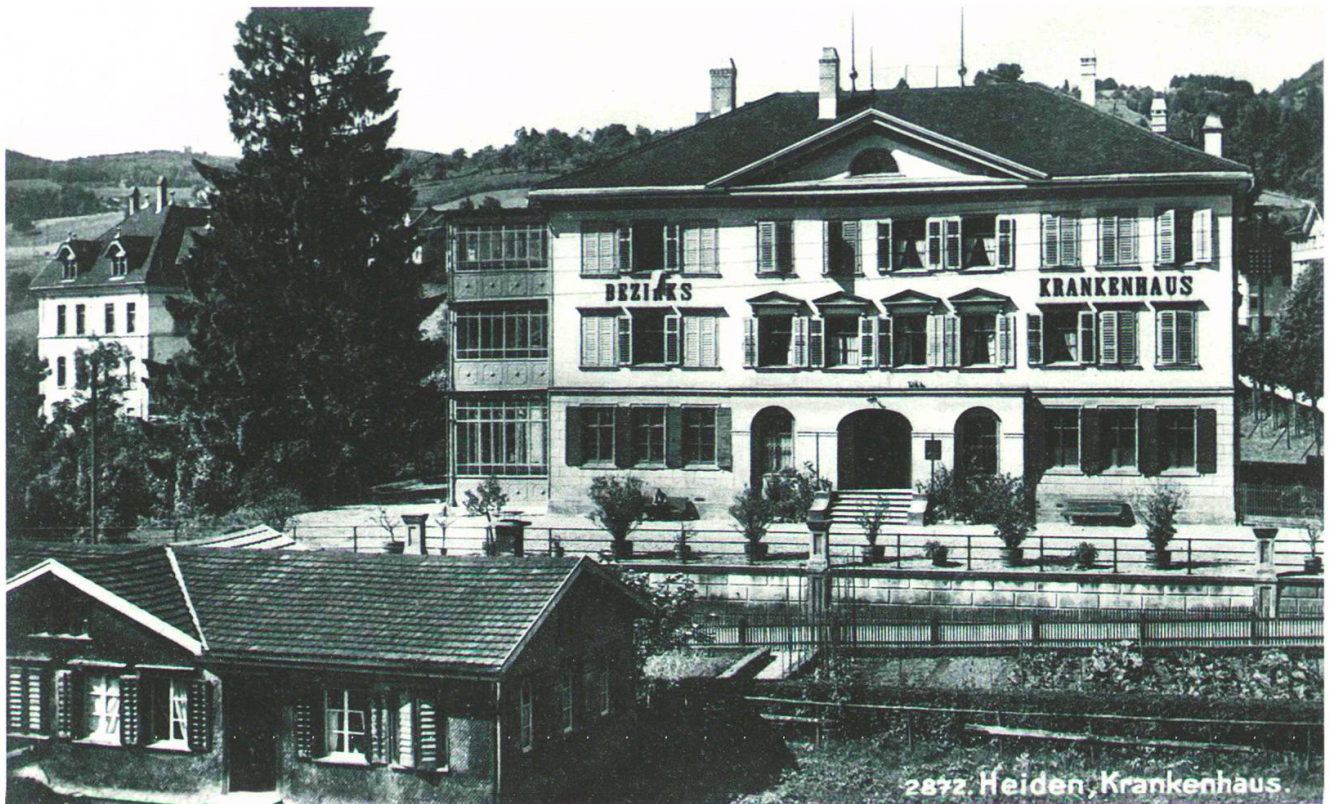
Bezirkskrankenhaus Heiden, ca. 1917. Im Erdgeschoss befindet sich seit 1998 das Dunant-Museum.

26 Vgl. Amann, Rudolf Müller (wie Anm. 23), S. 19.