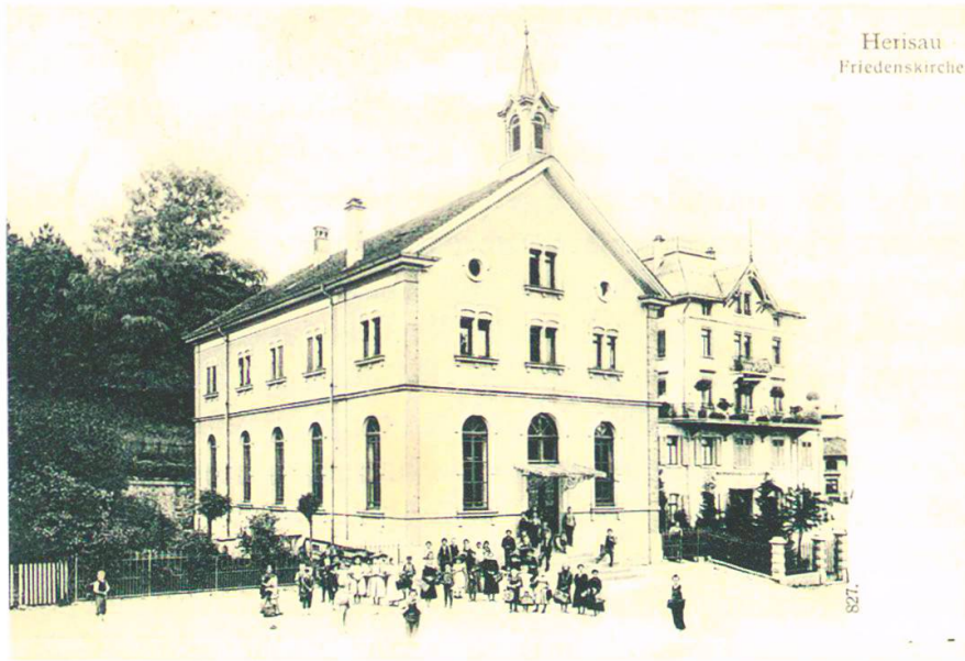
Friedenskirche an der Poststrasse 17, Kirche der methodistischen Glaubensgemeinschaft, Postkarte mit Poststempel vom 28. 07. 1909.

würden öfters auch den landeskirchlichen Gottesdienst besuchen. Die Methodisten seien die grösste Gruppierung. 62 Das auch in bildlichen Quellen greifbare methodistische Gotteshaus an der Poststrasse in Herisau besteht seit 1892. Die Landeskirche würde sich tolerant verhalten. Sie lasse die Sekten, «soweit sie innerhalb der sittlichen Ordnung sich bewegen, frei schalten und walten.» Mit der Religionsfreiheit werde ernst gemacht; es dürfe auch nicht übersehen werden, dass sich unter den Sekten oft wahrhaft fromme Leute befänden.