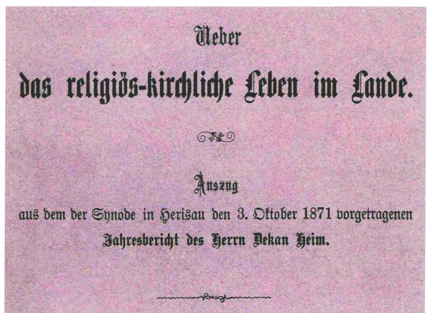
Titelseite der wegweisenden Abhandlung «Über das religiös-kirchliche Leben im Lande» von Dekan Heinrich Jakob Heim.

1886 reflektierte Heim in den Jahrbüchern unter dem Titel «Die neueste konstitutionelle Entwicklung der reformierten Landeskirche von Appenzell A.Rh.» die Jahre der Umgestaltung der evangelisch-reformierten Kirche von der Staatskirche zur Landeskirche. 60 Die fundierten sitten- und kirchengeschichtlichen Arbeiten verpflichteten: Der nicht minder umtriebige und dem Gesundheitsdiskurs des ausgehenden 19. Jahrhunderts verpflichtete Pfarrer Gottfried Lutz (1841–1908), Präsident des Kirchenrats, Erzieher von Arthur und Howard Eugster und seit 1882 im Einsatz zugunsten einer «kantonalen Irrenanstalt», publizierte 1895 einen 57-seitigen Bericht über das kirchliche und religiös-sittliche Leben im Kanton für die Jahre 1883–1892. 61 Sein Katalog der «religiösen Sekten» umfasste Methodisten, Baptisten, Darbysten, Irwingianer, Swedenborgianer und Anhänger der Heilsarmee in Herisau. In Teufen würden einige Adventisten und Sabbatianer dazukommen. Damit seien alle Sekten aufgezählt, «die bald mehr, bald weniger gesammelt hin und her in den Gemeinden unseres Ländchens auftreten und entweder am eigenen Orte ihre Erbauungsstunden haben, oder auswärts ihre Konventikel besuchen.» Wie schon Heim festgestellt hatte, fanden sich keine Mormonen mehr. Glieder der weniger ausbreitungssüchtigen Denominationen, wie Lutz festhielt,