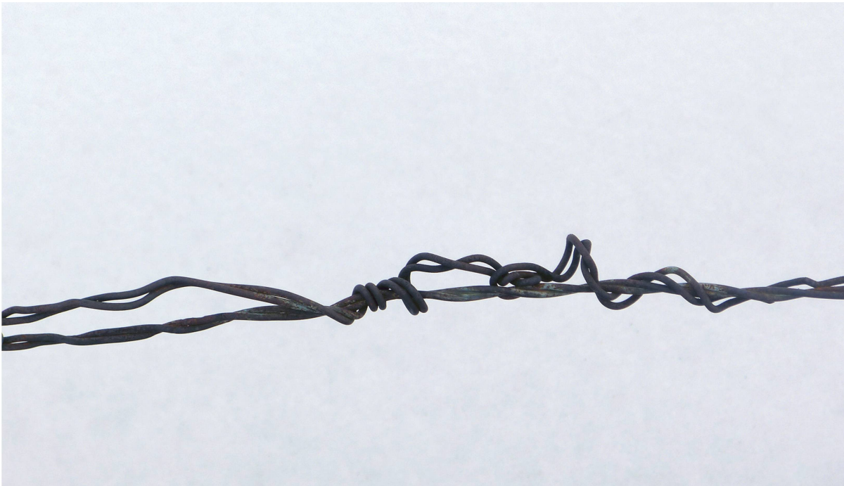
Fotoserie von Christina Waidelich, Februar 2013 (siehe Seite 48).

Würde sich das Bedürfnis nach Anerkennung, das jedem Menschen innewohnt, mit der Überzeugung paaren, dem Wohle aller zu dienen, hätten wir vielleicht paradiesische Zustände. Aber der Mensch ist Mensch. Er braucht Regeln und lernt im besten Fall schon als Kind, dass es Grenzen gibt und Regeln im positiven Sinne das Miteinander mitgestalten. Und er braucht die Erfahrung, dass es sich lohnt, sich für «das Gute» einzusetzen.