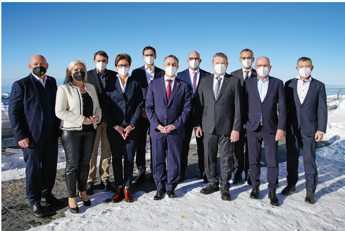
IBK-Gipfeltreffen auf dem Säntis mit Bundespräsident Ignazio Cassis (Mitte).

Die 1972 gegründete IBK ist das politische Dach der grenzüberschreitenden Zusammenarbeit in der Bodenseeregion. Ziel der IBK ist es, die Bodenseeregion als attraktiven Lebens-, Natur-, Kultur- und Wirtschaftsraum zu erhalten und zu fördern sowie die regionale Zusammengehörigkeit zu stärken. Zu den zehn Mitgliedern zählen die Bundesländer und Kantone Baden-Württemberg, Schaffhausen, Zürich, Thurgau, St. Gallen, Appenzell Ausserrhoden, Appenzell Innerrhoden, das Fürstentum Liechtenstein, Vorarlberg und Bayern.