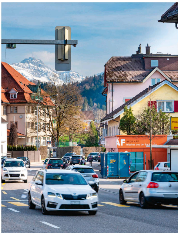
Viel Verkehr an der Alpsteinstrasse in Herisau: Wann der Autobahnzubringer Entlastung bringt, ist nach wie vor ungewiss.

bleme in der Region auf die lange Bank geschoben werde. Der Ausserrhoder Nationalrat David Zuberbühler hakte im Parlament nach und wollte vom Bundesrat wissen, was dieser gegen den geplanten Autobahnzubringer habe. In seiner Antwort bekräftigte der Bundesrat seine Einwände gegen das Projekt: veraltet, zu teuer, zu wenig Nutzen. Er merkte jedoch gleichzeitig an, dass dies nicht bedeute, dass der Bund nichts unternehmen wolle.