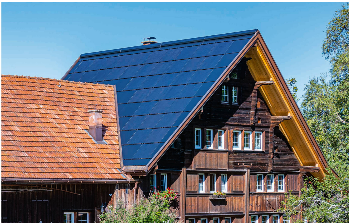
Das teilrevidierte Energiegesetz fördert unter anderem den Bau von Photovoltaikanlagen.

waren. So überprüfte das Amt für Militär und Bevölkerungsschutz die Zuteilung der Schutzzräume für die Ausserrhoder Bevölkerung sowie deren Versorgung mit Jod-Tabletten.